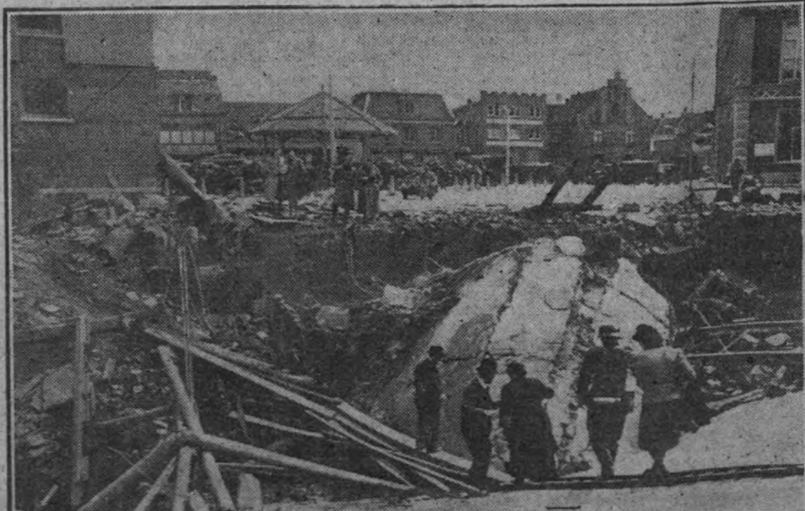
Las unidades holandesas pretendieron atenuar el ritmo de su retirada mediante el empleo de las destrucciones militares. La fotografía muestra las ruinas de un viaducto volado por los soldados de la Reina Guillermina.