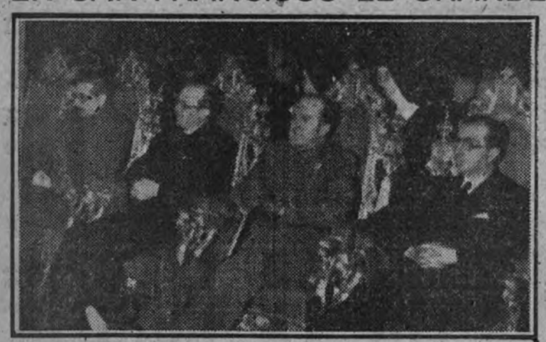
Los ministros de Asuntos Exteriores y de Educación Nacional, con el gobernador militar de Madrid y el subsecretario de Marina, en la presidencia de la solemnidad religiosa.