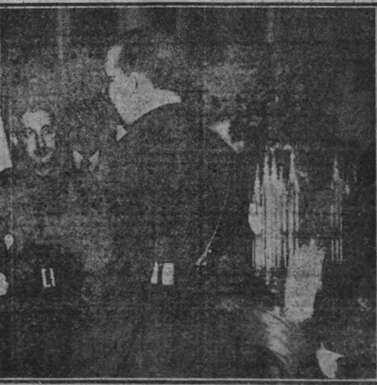
El jefe del Estado y Generalísimo de los Ejércitos de Tierra, Mar y Aire, escuchando las palabras del presidente de la Federación de Arroceros ofreciéndole la arquilla que simboliza la cosecha de la Victoria. (Información en tercera página.)