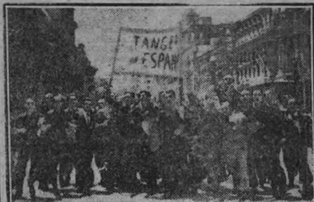
Una de las manifestaciones juveniles que recorrieron las calles de Madrid al conocer la noticia de nuestra intervención en Tánger, expresando su entusiasmo y su fe en España y su Caudillo

Reunida la Junta Política en la tarde de hoy, tras de ocuparse de diversos temas concretos de organización interior del Partido, acordó transmitir al Caudillo y Jefe Nacional, como mantenedor en el mundo de la fecundidad de la Victoria de España, la expresión de la gratitud más emocionada y fervorosa de toda la Falange, que hoy, más que nunca, se agrupa en torno suyo, en la más firme y esperanzada obediencia.