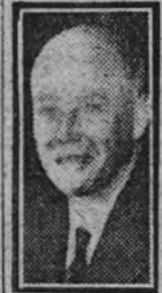
Mr. William Bullitt, embajador de los Estados Unidos en Francia, que fué encargado de hacer la entrega de París a las tropas alemanas

GIBRALTAR 14.—Un convoy, formado por 27 barcos mercantes, escoltados por cinco unidades de guerra, ha salido esta mañana con rumbo desconocido. (Efe.)