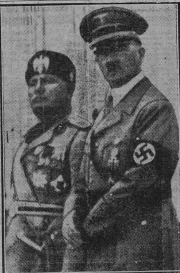
Adolfo Hítler y Benito Mussolini han convenido las condiciones de la paz con la Francia vencida por el imperio de la justicia y de las armas. Su acuerdo, realizado con la militar sobriedad que corresponde a la unión irrevocable del destino de ambos pueblos, pondrá el orden europeo en manos de quienes han sabido forjarlo con algo más que con vanas invocaciones a la paz.

ROMA 18.—El "Corriere della Sera" publica el rumor que circula en Washington de que Londres había pedido a Roosevelt una mediación cerca de los Gobiernos de Roma y Berlín, a los efectos de la paz. (Efe.)