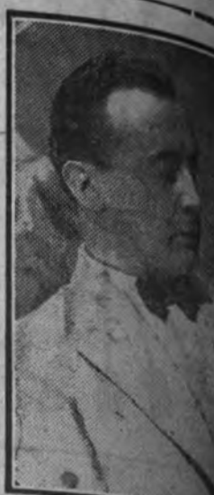
El célebre actor Ivan Petrovich, protagonista de "Sacrificio de mujer", film HIAF que estrena mañana en el Palacio de la Prensa

El film "La campaña de Polonia" transporta al espectador al campo de batalla, y le hace presenciar una de las más brillantes y rápidas conquistas guerreras de la historia de la humanidad. Ningún documental cinematográfico tan emocionante y tan lleno de interés como éste, en el que, con toda fidelidad y verismo se refleja la asombrosa gesta del Ejército alemán en la guerra relámpago de Polonia.