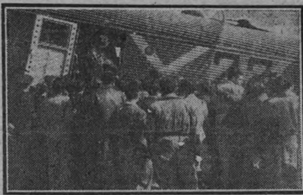
En aviones puestos a disposición de la C. N. S. por el ministerio del Aire, los obreros madrileños reciben su bautismo aéreo

de altitud, existe el propósito de establecer los domingos un tren especial para la sierra, simultaneándolo con otros a ciudades históricas. Además de esto, el anunciado veraneo de quince días, trasladando personal del interior a las playas y de las playas al interior, con desplazamientos a lugares de interés turístico e industrial, próximos a su provincia por la módica cantidad de 175 pesetas, incluido el alojamiento, en las playas mejores del Norte y Levante.