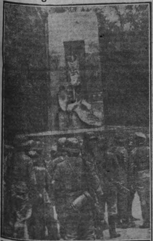
En el monumento con que Francia quiso conmemorar el armisticio de 1918, en el bosque de Compiègne, han sido colocadas las banderas de la Alemania victoriosa.