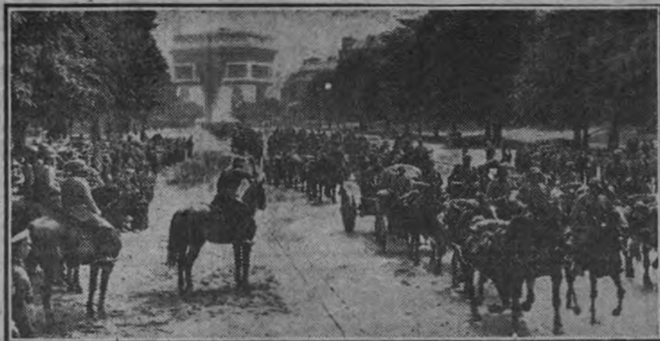
Una columna alemana desfila por la plaza de la Estrella, bajo el Arco del Triunfo. Ante el monumento de la gloria bélica francesa, las fuerzas alemanas ponen un epílogo dramático al último episodio militar.