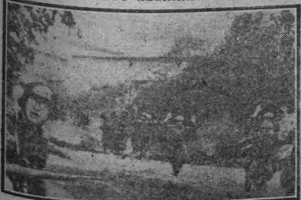
Los escasos elementos franceses que trataron de dificultar la rápida progresión alemana en los alrededores de París, fueron prontamente reducidos y obligados a rendirse.