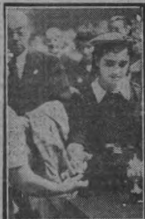
Carmencita Franco entrega los premios a las ganadoras del campeonato de baloncesto de la S. F. de Falange

Al final del encuentro, Carmencita Franco, hija del Jefe del Estado, hizo entrega de los premios, acompañada por los que componían la presidencia: general Moscardó, Miguel Primo de Ri-