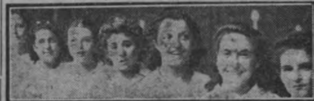
El equipo de Madrid B, ganador del campeonato de España de la S. F.

Los partidos de baloncesto Trofeo Aguilera, el festival del Stadium y los partidos de pelota fueron suspendidos.