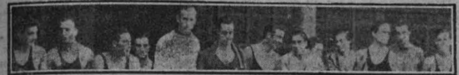
El equipo de Castilla, que ayer se enfrentó al portugués "Sport de Alges e Dafundo"

Se celebró ayer, con mucho público, el "match" de natación entre los portugueses y los seleccionados de Castilla. Apremiados de espacio nos impidieron dar referencias más completas. Por otro lado, una mirada por los adjuntos resultados técnicos será suficiente. Haremos mañana, con más calma, moral y materialmente, una crítica de conjunto.