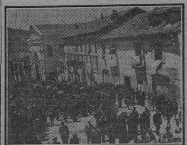
La fúnebre comitiva a su paso por las calles, camino del cementerio.

SAN LORENZO DE EL ESCORIAL 3. —Con toda solemnidad se ha celebrado el traslado a El Escorial de los restos de los mártires asesinados por los rojos durante la Cruzada. Los féretros, que fueron depositados en la iglesia parroquial, venían cubiertos con banderas nacionales. El pueblo en masa se sumó al acto, cubriendo los balcones de las casas de colgaduras negras con el "Presente" a los caídos. En la presidencia del duelo, con los familiares de las víctimas, figuraban las autoridades locales. Fuerzas de la Falange dieron guardia toda noche en la capilla ardiente.