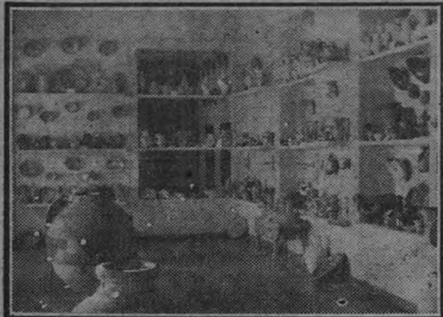
Una sala de la Exposición.

Instalado en el antiguo ministerio de Marina, figuran en él 177 trajes de todas las regiones