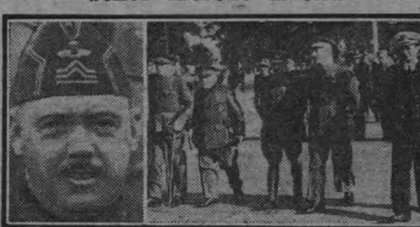
Presidencia del entierro del general Moreno Abella, de Aviación, en la que, entre otros generales, figura el ministro del Aire, general Vigón. (Foto Contreras).

Ha fallecido el general de Aviación D. Luis Moreno Abella, marqués de Borja, militar ilustre, condecorado con la Medalla Militar Individual.