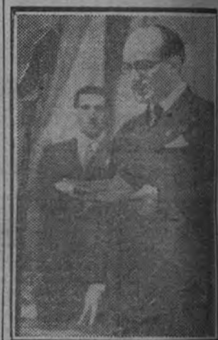
El ministro de Educación Nacional durante su discurso de clausura.

Terminó el ministro de Educación Nacional sus vibrantes palabras con el grito de "¡Arriba España!"