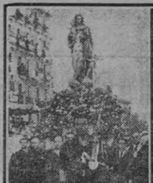
La Falange da guardia a la imagen de la Virgen del Carmen a su paso por las calles de Madrid.

ORGANO DE FALANGE ESPAÑOLA TRADICIONALISTA Y DE LAS J. O. N. S. DIARIO DE LA MAÑANA • 15 CENTIMOS