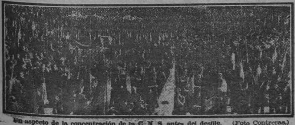
Un aspecto de la concentración de la C. N. S. antes del desfile.

No se divisaba aún en la avenida el coche del Caudillo cuando su presencia nos fué anunciada por el clamor fuerte y unánime del pueblo que gritaba: "¡Franco, Franco, Franco!" Poco después aparece el coche oficial y a las aclamaciones lejanas se unen las nuestras. Eran las diez y media de la mañana cuando el Generalísimo Franco llegó a la tribuna desde la cual había de pasar revista a las fuerzas de los Ejércitos de su mando y a las fuerzas de la Central Nacional Sindicalista, también por él guiadas y conducidas. Fué recibido Su Excelencia el Generalísimo, que llegó en un coche descubierta acompañado del jefe de su Casa Militar, general (Continúa en quinta página.)