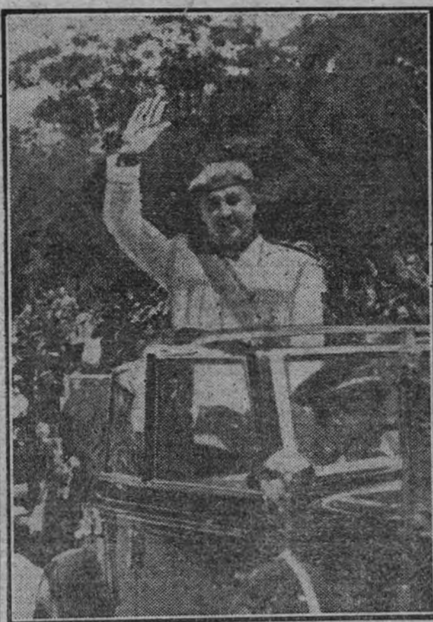
El Jefe del Estado y Generalísimo de los Ejércitos de Tierra, Mar y Aire recibe el tributo de adhesión y cariño del pueblo madrileño, que le aclama al llegar a la tribuna.

Madrid renueva sus aclamaciones a los soldados de la Victoria