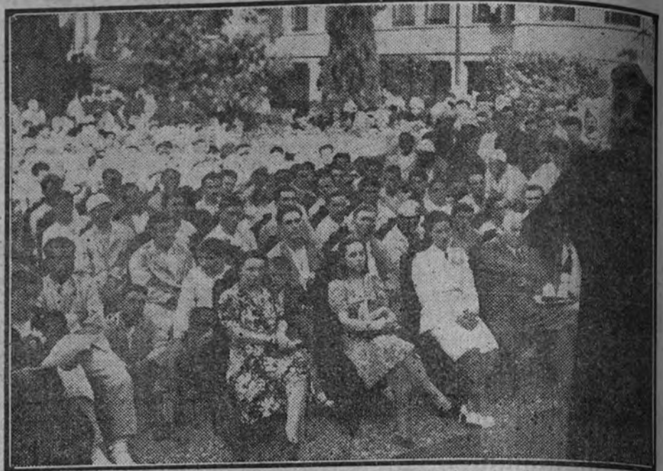
En Milán, en una casa de reposo, artistas de variedades italianos dieron una representación para los soldados que vuelven del frente.