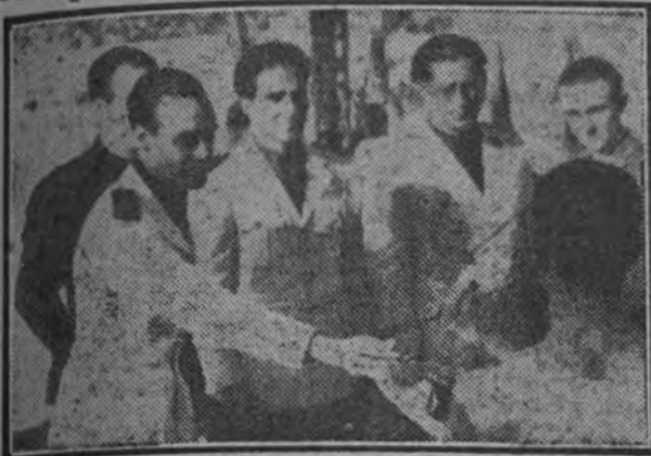
El ministro vicesecretario del Partido haciendo entrega de los trofeos a los vencedores en las pruebas deportivas de Educación y Descanso.

No exagerábamos nada cuando ayer anunciábamos que los campeonatos de atletismo del productor se cerrarían con una fiesta apoteósica. No exagerábamos nada. Y si hemos acertado, no será por chripa, sino porque sabíamos que la organización estaba preparada para que el público sintiera la satisfacción de que en España se saben organizar estas cosas con la misma perfección que en el extranjero.