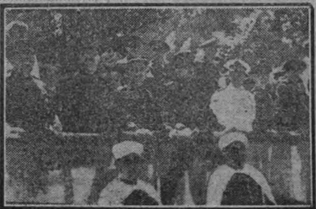
El Gobierno presenciando el desfile desde la tribuna.

Ha de ser para nosotros la Revolución nacional una pura razón de existencia. Sólo Dios puede saber por qué hoy nos toca resolver el paso de una a otra época histórica. Si estamos vinculados por la tradición a una historia donde el bien y el mal combaten sin cesar con resultado indeciso, lo estamos más a la historia que nace victoriosamente, y en cuyas páginas ha de ser vencido el mal de un modo permanente. Dentro de la conciencia de todos los españoles debe levantarse ya la angustia creadora que nos ordena el sacrificio. Dejemos nuestras victorias pretéritas al pie de los altares conmemorativos y caigamos de una vez, decididamente, con el alma y la vida puestas a ello, sobre el campo de batalla en que resiste aún desordenadamente la lorda de nuestras viejas pasiones. Una sola pasión está justificada por la sangre vertida un día: la pasión de la España que nos corresponde salvar y cuyas tierras y mares habrán de hundirse o levantarse a impulsos del fervor de nuestra sangre.