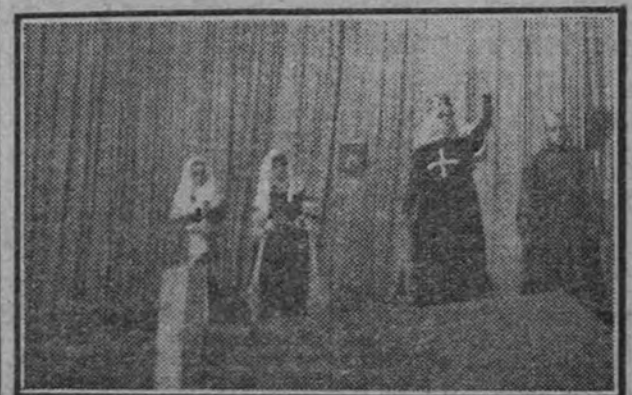
Una escena de la obra representada por el Teatro de la O. J. en el Retiro.

Ante la imposibilidad material de reseñar todos estos actos, como sería nuestro deseo, por falta material de espacio, nos limitamos a publicar esta breve nota para registrar el volumen e importancia de este acontecimiento que demuestra el resurgir de España.