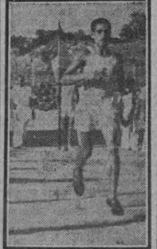
Salida de la carrera de relevos para depositar una corona en la tumba de José Antonio.