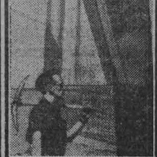
Los directores de los distintos Sindicatos escuchan los discursos que precedieron al desfile.

Por todo Madrid circularon bulos y rumores que pretendieron esconder, dividir, separar la significación del acto. Se pretendió oponer al pueblo que trabaja, al que milita en los Sindicatos, frente al pueblo que milita en el Ejército. Se pretendió decir que este acto tenía una significación contraria al que en este mismo día, y con separación sólo de sitio, se está celebrando. Frente a tales bulos, frente a tales afirmaciones, frente a tales rumores, que obedecen a inspiraciones extrañas, pero bien conocidas, nosotros alzamos estas puras y estrictas palabras: los sindicatos madrileños, dentro de breves minutos, declinarán ante el Generalísimo Franco, Caudillo de España y Jefe Nacional de la Falange, en homenaje al mismo, porque él es la más alta representación de las virtudes castrenses que ha conocido la Historia de España; porque él es el soldado invicto que comenzó una gesta heroica el 18 de Julio de 1936, y hoy se apresta a comenzar otra por la reconstrucción rural y material de España; porque, en virtud de esta decisión firme de su voluntad, que nosotros conocemos, le podemos calificar padre de la Patria; porque, en virtud de la firmeza, del tesón, de la tenacidad, del espíritu revolucionario y enérgico con que ha de emprender, de llevar a cabo seguida, leal y disciplinadamente a todos cuantos estamos aquí, podemos llamarle conductor único y auténtico de la Revolución nacional-sindicalista.