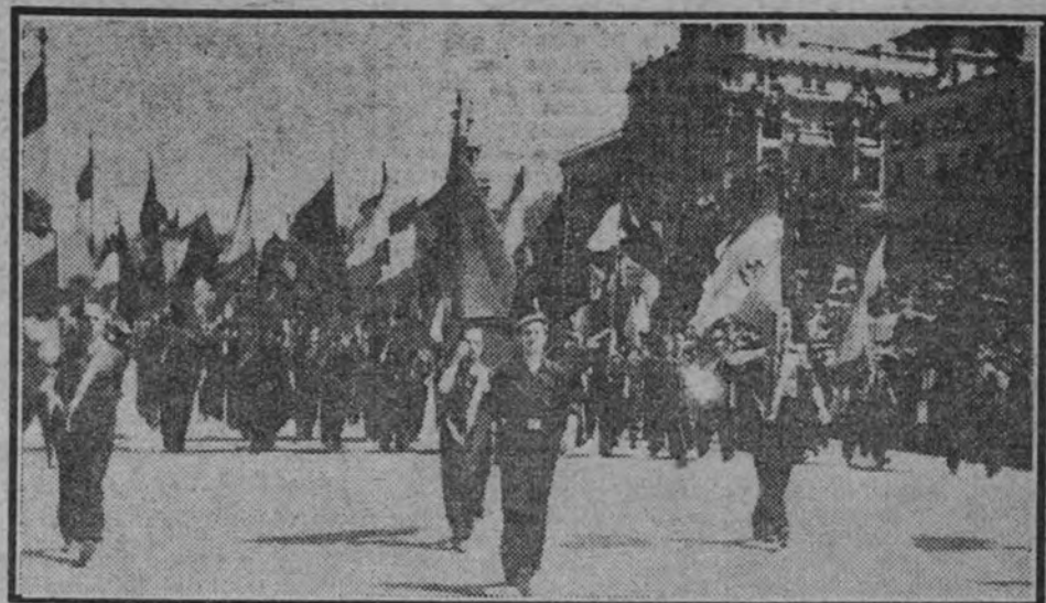
Cabeza de uno de los Sindicatos en el desfile de ayer ante el Caudillo.

En la zona de Recreos del Retiro la Delegación Provincial de Organizaciones Juveniles de Madrid celebró una gran función de teatro, con la cooperación del Ayuntamiento, para sumarse así a los grandiosos actos del día. Concurrieron a ella el Ayuntamiento, el delegado nacional de