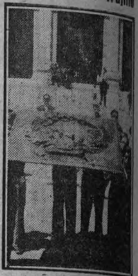
Corona de bronce sobre plancha de caoba que el Presidente de la República Dominicana dedica a la memoria del primer Jefe nacional de la Falange.

EL ESCORIAL 25.—Procedente de Madrid llegó por la mañana el ministro de la República Dominicana en España, acompañado del primer secretario, con objeto de depositar una corona de bronce en la tumba de José Antonio. El representante diplomático fué recibido en la puerta de la Basílica por el prior de la Comunidad, el alcalde de la ciudad, secretario provincial del Movimiento y otras autoridades locales. Una sección de F. E. T. y de las J. O. N. S., con bandera y música, rindió honores a la entrada del Monasterio. En el momento de la ofrenda el ministro dominicano pronunció unas palabras. Calificó de apóstol de la Hispanidad a José Antonio. Afirmó que la promesa de otro Imperio está próxima a cumplirse. El prior pronunció después un discurso en el que dió las gracias por el homenaje rendido al Fundador de la Falange. Después se rezó un responso. Terminada la ceremonia, en el Patio de los Reyes, se cantó el "Cara al Sol". El ministro dominicano regresó a las seis de la tarde a Madrid. La corona depositada sobre la tumba de José Antonio lleva la siguiente inscripción: "El generalísimo Rafael L. Trujillo a la memoria de José Antonio Primo de Rivera. Dios, Patria y Libertad. República Dominicana". (Cifra.)