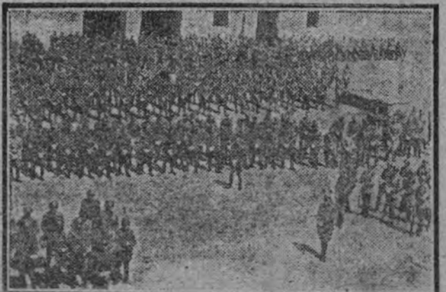
El patio del cuartel del Conde Duque durante la ceremonia religiosa con que comenzaron los actos con motivo de la festividad del Santo Apóstol