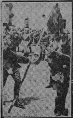
Los reclutas jurando la bandera en el cuartel de Conde Duque.

La Hermandad del Apóstol Santiago, integrada por funcionarios del Cuerpo de Telegrafistas, celebró el día de su Patrón concurriendo a una misa de comunión ge-