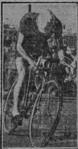
Carretero al llegar a la meta

En breve tendremos en Madrid un campeonato de España: el de los ligeros. Se enfrentarán el catalán Alonso y el catalán González.