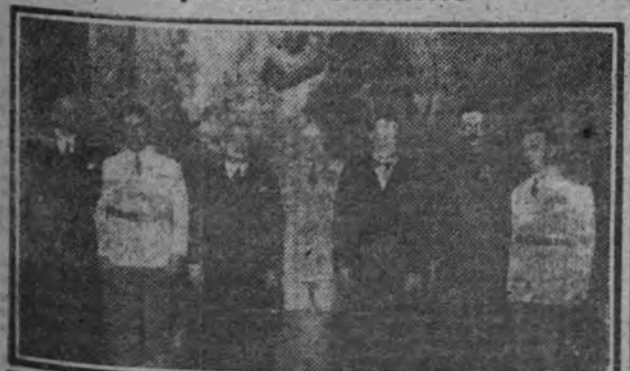
El ministro de Asuntos Exteriores, con la Misión diplomática brasileña que hará entrega al Generalísimo de la espada que le regala el Ejército de aquel país. Acompaña a la Misión brasileña nuestro embajador en Lisboa, D. Nicolás Franco.