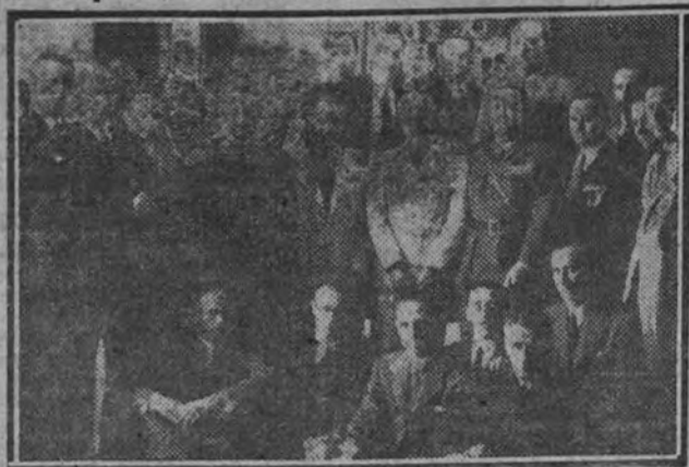
La promoción de abogados de 1923, de la que formaron parte José Antonio y el ministro de la Gobernación, señor Serrano Suñer, ha regalado a éste, como recuerdo cariñoso, una pluma de oro.