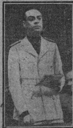
El ministro vicepresidente del Partido, pronunciando su discurso.

Concurrieron todas las representaciones de las diferentes ramas de las tres fases de producción, industria y distribución textiles, correspondiente a cada zona, y numerosas jerarquías sindicales.