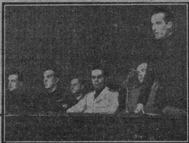
La presidencia, durante la constitución del Sindicato Nacional de la Industria Textil.

Ayer, a las doce de la mañana, en el edificio de la Delegación Provincial de Educación de F. E. T. y de las J. O. N. S., se celebró el solemne acto de la constitución oficial y definitiva del Sindicato Nacional Textil.