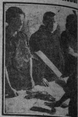
La delegada nacional, Pilar Primo de Rivera, tomando juramento.

Por último, se izó la bandera y se cantó el "Cara al sol", dando la delegada nacional los gritos reglamentarios, contestados con unanimidad entusiástica.