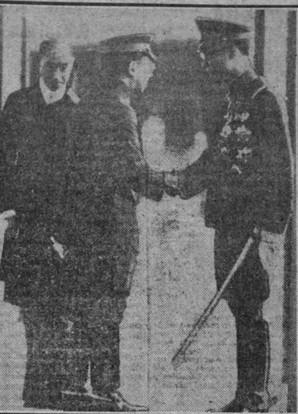
Para celebrar el XXVI centenario de la fundación del Imperio japonés, las más destacadas personalidades de Oriente se han congregado en Tokio. En la fotografía aparece el Mikado saludando al Emperador del Manchukuo.

Trece aviones ingleses fueron abatidos ayer por las fuerzas italianas