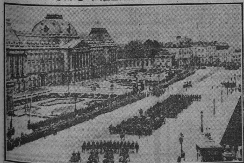
Fuerzas alemanas de Artillería montada desfilando ante el Palacio Real belga en Bruselas.