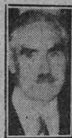
Sir Robert Craighie

TOKIO 6.—Los periódicos aprueban la determinación del Gobierno que hace depender las nuevas medidas de carácter definitivo de la actitud de Inglaterra respecto de las exigencias del Japón. Sin embargo, duda la Prensa de que esta cuestión pueda ser terminada con negociaciones.