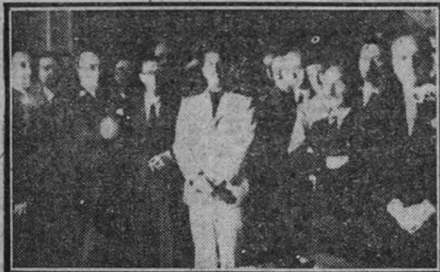
El director general de Administración Local rodeado de los representantes de las Diputaciones, después de la sesión de clausura de la Asamblea celebrada por las Diputaciones de régimen común.

Ayer mañana se celebró en el salón de sesiones de la Diputación la clausura de la Asamblea de la Mancomunidad de Diputaciones, presidida por el director general de Administración Local, señor Iturmendi.