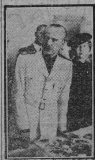
El ministro de la Gobernación, Sr. Serrano Suñer, pronunciando su discurso en el acto inaugural.

Enorme labor alemana de auxilio a los evacuados franceses