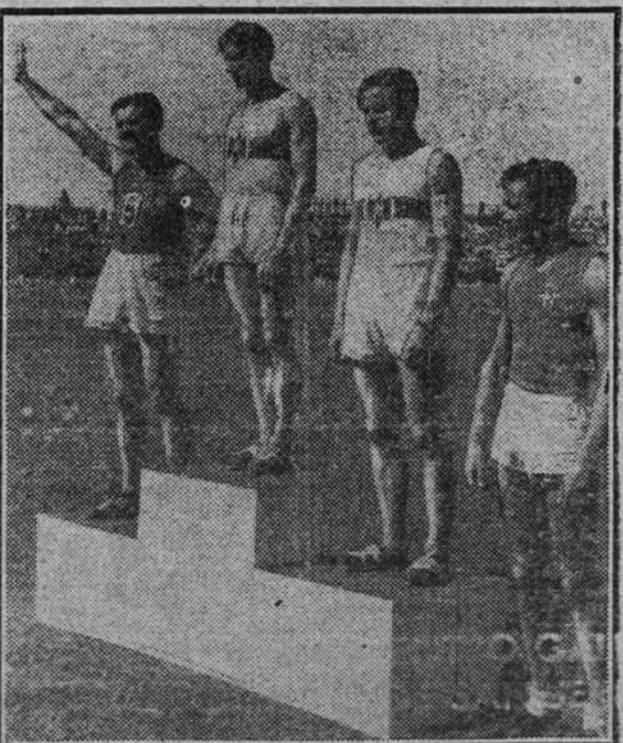
Después del Alemania-Italia de atletismo. El homenaje a los vencedores en 400 metros, que ganó Harbig