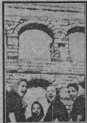
En la última excursión educativa realizada por la Organización Juvenil Femenina madrileña a Segovia, las muchachas en el acueducto.