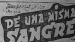
Amadeo Nazzari, en el film "De una misma sangre"

Cuatro premios ostenta esta producción excepcional, entre ellos la codiciada copa Mussolini, que el Duce instituyó para aquellas obras cinematográficas que unieran a su perfección técnica una grandeza ideológica que diera alientos de heroísmo a los muchachos de hoy y a los hombres del mañana.