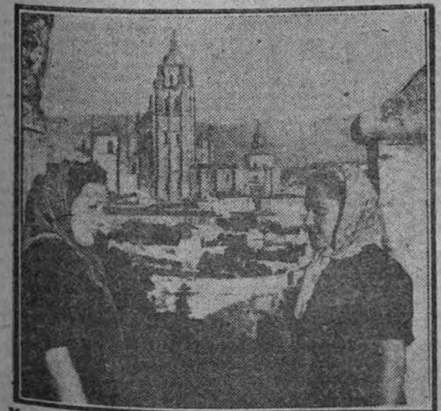
Muchachas de las O. J. de la Sección Femenina, en su reciente visita a Segovia.

Ciertamente la obra está—en este aspecto concreto— iniciada y proyectada con aliento; pero es preciso más: es preciso que su instrumentación sea eficaz, que su urgencia no se rebaiga por consideraciones formales de escrupulo administrativo, incompatible con nuestro modo revolucionario, de emprender las tareas. Es necesario en esto—como hemos convenido que lo era en lo grande e histórico—operar con esplendor, con generosidad y con decisión. Como quieren y dicen la Falange y su Caudillo, bajo los cuales no puede haber tibieza, obstáculos ni frenos.