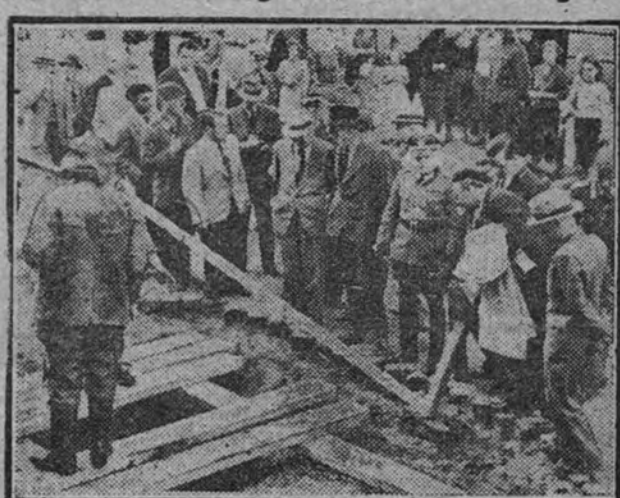
Mientras los "Stukas" alemanes atacan los centros industriales británicos y hundien un millón de toneladas de buques ingleses en veinte días, según el comunicado del Alto Mando del Reich, los aviones de Churchill han atacado con éxito los barrios obreros de Hamburgo. En la foto, podemos ver a los periodistas extranjeros comprobando los daños causados por los ataques ingleses contra los núcleos urbanos de la gran ciudad comercial del Mar del Norte.