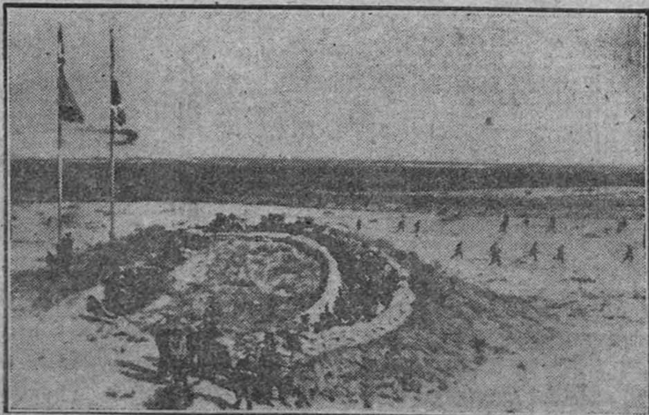
Desde un puesto avanzado en el desierto de la Somalia, fuerzas italianas despliegan para iniciar el ataque contra las posiciones británicas.