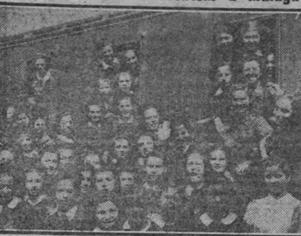
CORDOBA.—El primer turno de flechas femeninas cordobesas toman el tren para dirigirse al Campamento de Torremolinos (Málaga).