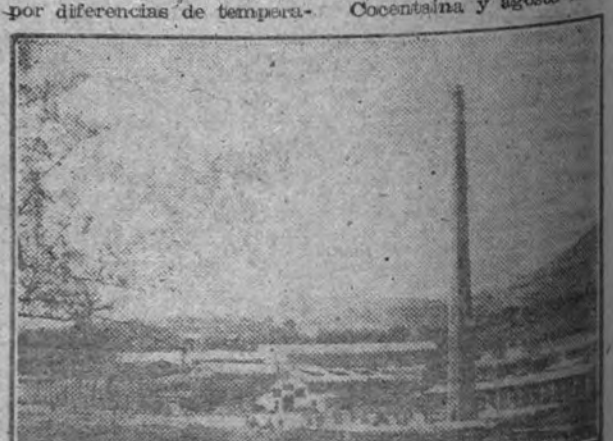
Vista general de una fábrica de cerámica de Cocentaina