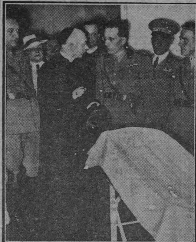
El cardenal Schuster durante su reciente visita a los establecimientos de la Cruz Roja italiana.