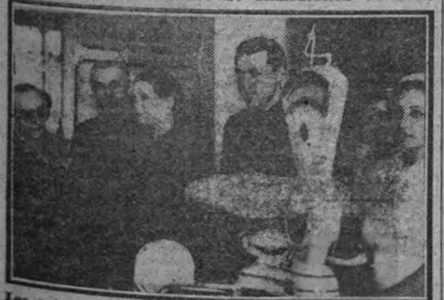
Las autoridades de Auxilio Social visitando las instalaciones del nuevo centro. (Información en segunda página.)