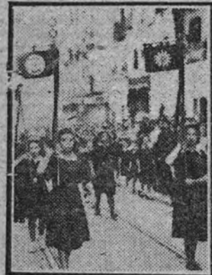
Las Organizaciones Juveniles del distrito formando en la procesión.

Por la tarde se celebró la procesión, con la venerada imagen de la Virgen de la Paloma, que recorrió las calles de la barriada, con la Virgen del Carmen, Ventosa, Puerta de Toledo, calle de Toledo, Latoneros, Puerta Cerrada, Cava Baja, Puerta de Moros, Carrera de San Francisco, Calatrava a Paloma.