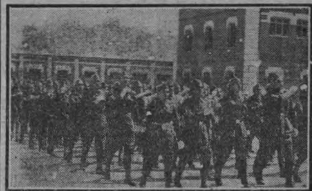
Los reclutas del regimiento de Infantería número 1 desfilan ante las autoridades, después de la ceremonia. Información en la página segunda.

Jura de la bandera de los reclutas del regimiento núm. 1