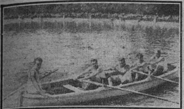
Campeonato de Remo de Educación y Descanso.—El equipo A, ganador de las pruebas de remos.

Gran brillantez en las pruebas de remo, en el Retiro y de ciclismo en el Estadio