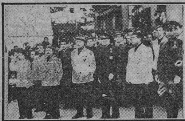
Autoridades y jerarquías del distrito presidiendo la procesión.

Con gran entusiasmo se celebró ayer la festividad de Nuestra Señora de la Paloma. Las calles de la populosa barriada se hallaban engalanadas y materialmente cubiertas de cadenas de los colores nacionales y azul y blanco.