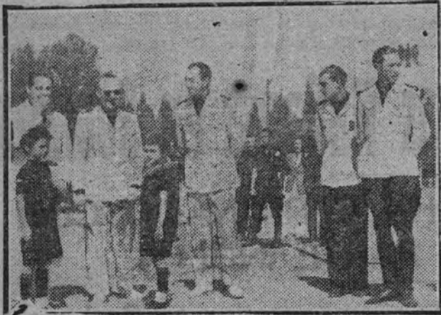
El presidente de la Junta Política y ministro de la Gobernación, Sr. Serrano Súñer, con sus dos hijos mayores, acompañado del delegado nacional de O. J. y del jefe provincial de Madrid, durante su visita al campamento "29 de Octubre", el domingo último.

El Sr. Serrano Súñer fué recibido por los flechas con grandes manifestaciones de entusiasmo