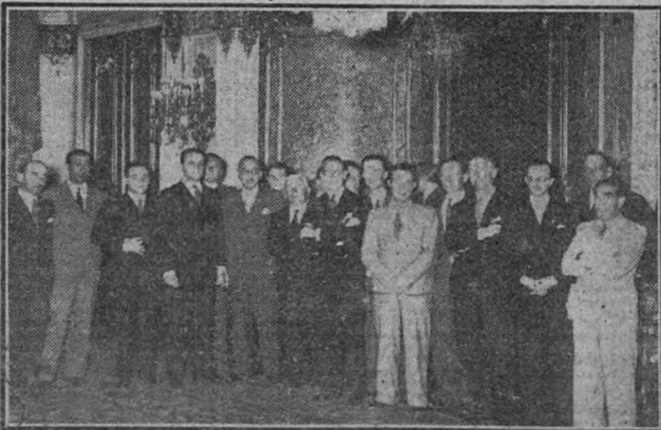
Los periodistas españoles que actualmente visitan el Reich, durante la fiesta celebrada en su honor en la Embajada de España en Berlín.