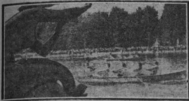
En primer término, los vencedores de las regatas de Educación y Descanso.

El público—la mejor guirnalda del éxito—volvió a decorar los cuatro costados del estanque del Retiro en la segunda jornada de regatas de Educación y Descanso. Madrid, sin mar, puede, merced a estas organizaciones, vivir unos momentos la ilusión de que lo tiene. Y si esta ilusión pareciera mezquina por las escasas proporciones del lugar, se agiganta por la prestación de actores y espectadores.