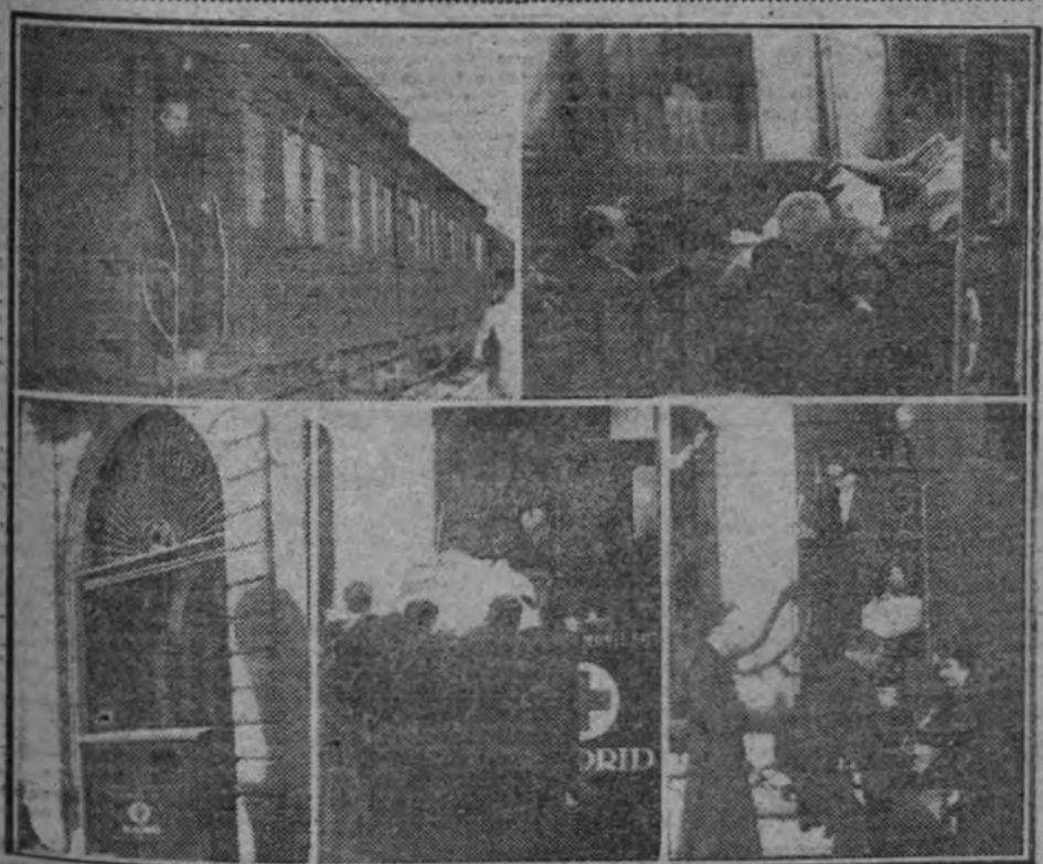
En estas fotografías se recogen varios momentos del traslado del primado de España, cardenal Gomá, desde Pamplona a Toledo. El vagón de ferrocarril en que el ilustre enfermo ha realizado el viaje; traslado de la camilla a la ambulancia de la Cruz Roja; entrada de la misma en el palacio arzobispal de Toledo, y, por último, los familiares del cardenal descendiendo del vagón a su llegada a Toledo.

En tercera plana, amplia información de la velada de boxeo celebrada anoche en la plaza de toros, en la que se disputaron el campeonato español de sus respectivas categorías los catalanes—Tarré, Paíró y González, y los aspirantes Gascón, Alonso y Gómez, "el Melonco". Fueron proclamados campeones Gascón, Alonso y Paíró.