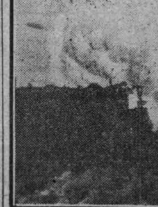
Cañón alemán de gran calibre haciendo fuego sobre objetivos indicados por la aviación en el Canal de la Mancha. (Foto Contreras.)

En el África oriental fué derribado un avión inglés por nuestros "Dubs", cerca de Coenica, en Kenya. (Efe.)