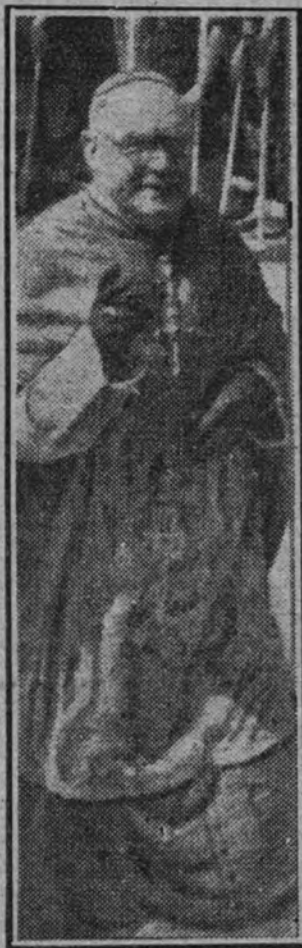
El Cardenal Primado de España, doctor Isidro Gomá.

BERLIN 22. (De la Redacción de la agencia Efe en la capital alemana).—Los periodistas españoles que han salido esta noche del territorio del Reich con dirección a París. Desde esta capital proseguirán su viaje de regreso a España. (Efe.)