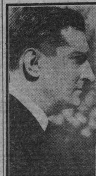
Oliveira Salazar, que ha abandonado la cartera de Hacienda

Pero una segunda circunstancia producida en el cambio de ministerios portugueses queremos señalar especialmente por la actualidad indudable que debe tener en nuestras propias preocupaciones, y es: la extensión de esta tónica unificadora y simplificadora al campo de lo económico-social. En efecto, siempre—pero más hoy, frente a crisis, bloqueos y políticas de defensa—lo económico constituye la base instrumental de una política, y forma en la misma un bloque único e indivisible: no puede haber una política industrial, otra agrícola y otra de trabajo; hay simplemente una política económica, porque por un solo camino es preciso servir a las necesidades populares y por uno solo—extendido a toda la economía—acuden a ella las complejidades exteriores. Portugal, al tomar esta medida, rectifica, probablemente, en mucho su política, contraria fundamentalmente en lo financiero estatal, para entrar en una fase más coordinadora y de acción más amplia. Sea como fuere, esta, como la otra medida subrayadas, no son—en la esfera que permite el ámbito y naturaleza del régimen portugués—sino un reflejo de la consigna universal de la hora: moral de peligro y reordenamiento de la política de unidad.