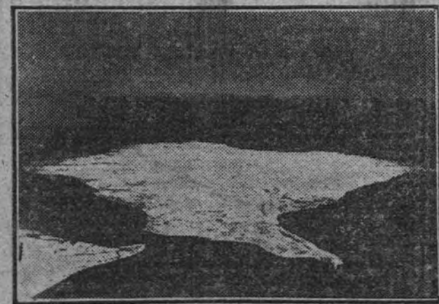
Cast en medio del espacio Portland-Dover se encuentra la isla Wight. La foto está hecha desde una altura de 5.500 metros situada al Oeste. La punta de la izquierda es el puerto de Portsmouth.

regirinos de las Juventudes masculinas de Acción Católica. Esta tarde, a primera hora, ha llegado un tren especial, que ha sido recibido por los directivos nacionales y juveniles de Zaragoza. Para las cinco menos cinco se espera la llegada de otro tren especial de Madrid. La animación por las calles es extraordinaria. (Cifra.)