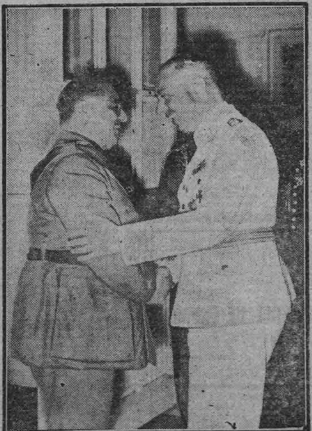
El general alemán Wollmann conversando con el general Aras. La fotografía fué tomada en junio de 1939

En nombre del Führer y del ministro de Propaganda, doctor Goebbels, Hadamowski hizo ofrenda de dos magníficas coronas. (Efe.)