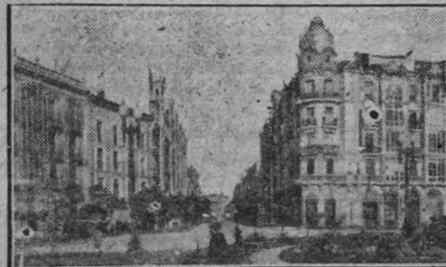
Valladolid.—Calle de Miguel Iscar

En el aspecto histórico, cuántas cosas nos dicen los rincones y callejuelas, cascos y palacios, iglesias y torres que abundan en Valladolid antiguo! La Antigua, reina de las torres románicas de Castilla; San Martín; los palacios de los Benavente y los Vivero, la casa donde nació el segundo de los Fajos, el antiguo Palacio Real, el de Fabio Nelli; ese joyel del arte del tiempo de la gran Reina de las Españas, primer de piedra, labrado por la magnificencia de fray Alonso de Burgos; el Colegio de Santa Cruz... y tantas y tantas cosas más, entre las que no podemos olvidar el Archivo de la Real Chancillería.