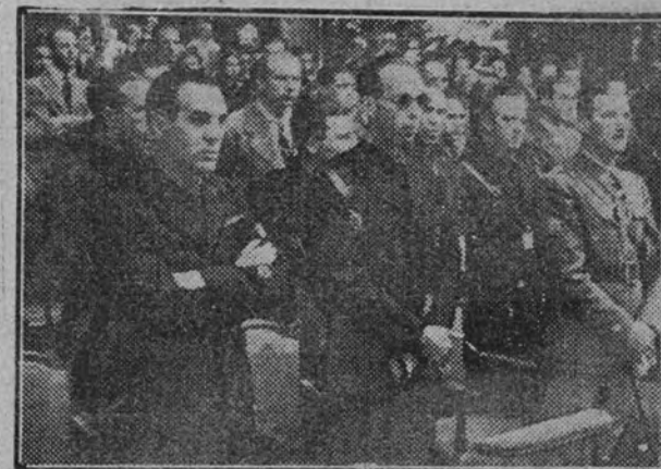
La presidencia del acto en la concentración de los 6.000 productores.

Tenemos la certeza absoluta de que el Jefe del Estado y Jefe Nacional de la Falange, de que el Caudillo Franco, ha jurado salvar, feliz y totalmente, las doctrinas de la Falange. No hace muchos días me decía personalmente que tenía el decidido propósito de llevar la economía y el fuero de lo social de España por la vía sindical. Y lo afirmaba con una doble expresión, porque, no sólo el Jefe del