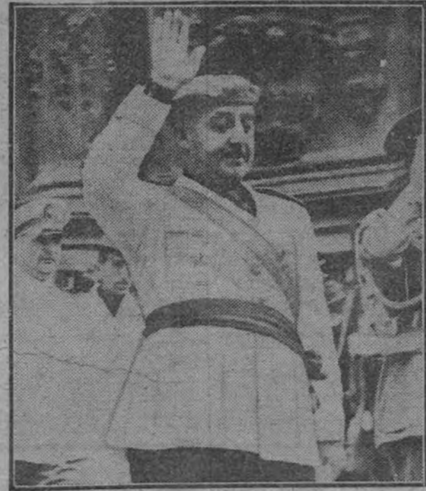
Su Excelencia el Jefe del Estado al salir de la iglesia de Santa María, después de asistir a la coronación de Nuestra Señora la Virgen del Coro.