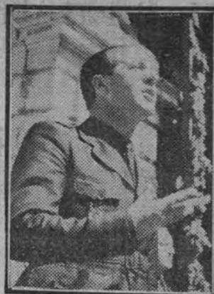
El delegado nacional de Sindicatos, Gerardo Salvador Merino, pronunciando su discurso ante los productores de la localidad en la concentración celebrada en los Jardines del Príncipe.

Por todo ello os vuelvo a repetir, como en los momentos difíciles, que hay que luchar y lucharemos por el triunfo del nacionalsindicalismo, con el pecho unido fuertemente para el servicio de