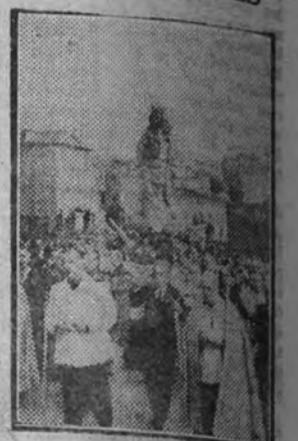
La procesion de la Virgen de la Almudena, Patrona de Madrid, a su paso por las calles de la capital

Después de los sacerdotes oficiales iba la presidencia oficial, formada por el gobernador militar, general Sáenz de Buruaga; el secretario del Gobierno Civil, ca-