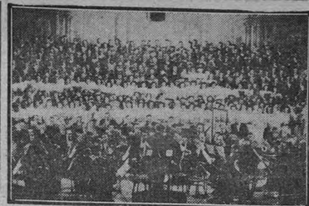
Concierto de inauguración de la gran quincena musical de San Sebastián

¿Y las almas desgarradas? A éstas habrá también que reconstruirlas, que meterlas en las veredas de la ilusión. Con piedras de escándalo, como la Iglesia del Señor por el Santo, así serán levantadas en vilo para la tarea común. ¡Que cada lágrima derramada levante una piedra! ¡Que cada ilusión en flor mueva una rueda! Hay que estar tensos para auparse sobre los hombros de todos la primavera.