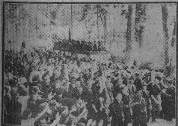
Terminado el acto, los productores de Aranjuez desfilan ante las autoridades.

He de advertiros, repitiendo casi las palabras del delegado provincial, e insistiendo más sobre las conciencias, que no se os convoca para nada fácil. Que sabemos bien con las dificultades que tenemos que luchar, principalmente las producidas por la postguerra y los conflictos que actualmente tiene planteados nuestro Continente; y que estamos dispuestos a luchar, y que tenemos la pretensión de volver a los españoles todos, a las clases poderosas y a las humildes principalmente, el orgullo de ser nacidos en el solar hispano, con la certeza absoluta de su reconstrucción. Y por eso decimos que no os presentamos nada fácil, que la empresa es dura, demasiado dura; pero estamos plenamente seguros en el triunfo.