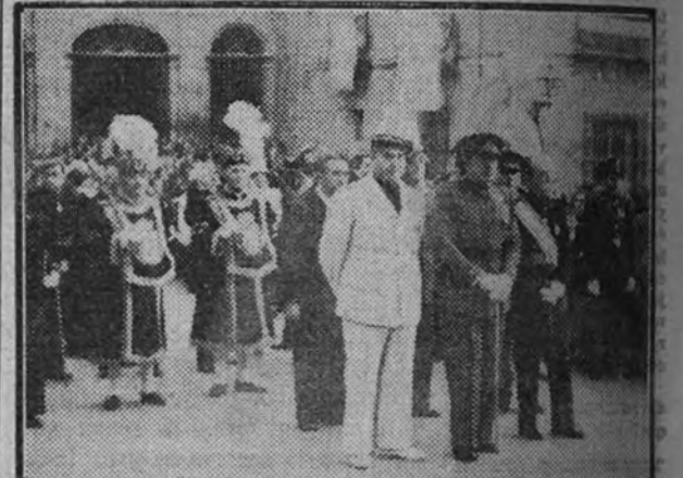
La presidencia de la procesion, formada por los gobernadores civil y militar y alcalde accidental, conde de Casal

Durante todo el recorrido fueron cantados himnos y oraciones en honor de la Virgen.