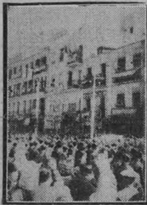
El público en el acto inaugural de la Subdelegación

En la mañana del pasado domingo, a las once, se celebró en la populosa barriada de Cuatro Caminos el acto inaugural de la Subdelegación Política de F. E. T. y de las J. O. N. S. del distrito de la Universidad.