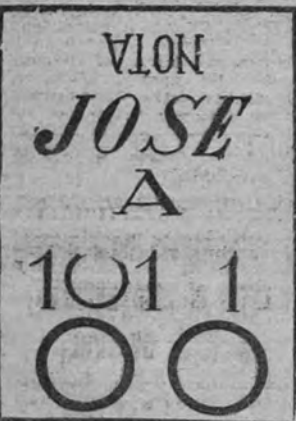
—Es una buena maleta. (La solución en el próximo número)

SOLUCION AL ENTRETENIMIENTO ANTERIOR Horizontales.—1. Envanecer. 2. Cianógeno. 3. Odiar. MD. 4. Non. Seguí. 5. Ostris. D.L. 6. Cati. EL. 7. Apio. Ce. 8. Sean. Er. 9. Os. S. R. Ora. Verticales.—1. Económico. 2. Niños. 3. Vainicas. 4. Ana. Rapes. 5. No. Sitar. 6. Egresión. 7. Ce. 8. Enmudecer. 9. Rodi. lera.