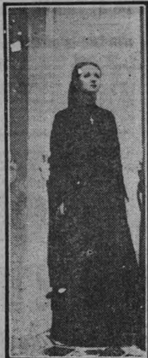
Danielle Darrieux, "estrella" de moda en el mundo cinematográfico, muestra en esta foto de "Katia"—su más destacada creación—su extraordinaria belleza y su línea admirable