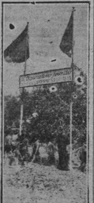
Entrada a un campamento de las O. J. en Málaga