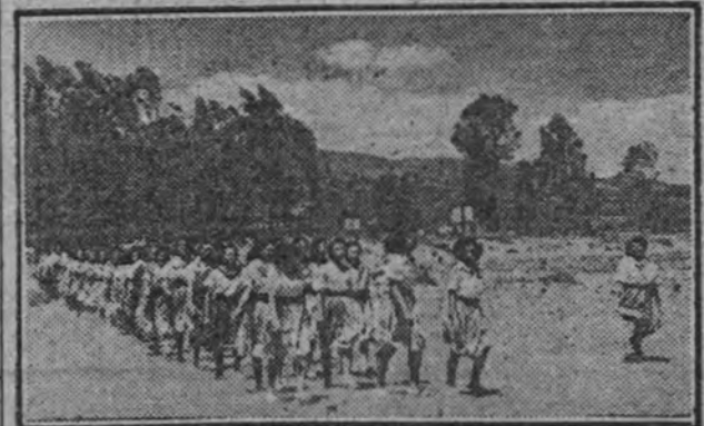
A la mañana, cara al sol radiante, envueltas en un viento que las cifo y curva la esbeltez de los chopos, allá van las camaradas jóvenes, sanas, alegres, fuertes, de la Sección Femenina a conquistar para la Falange los futuros hogares de España. (Información en quinta página.)

Es seguro que, frente a las peticiones de Roosevelt, las de Konoys serán de gran firmeza, y no menos continentales que las suyas. Nuestra simpatía va en este diálogo hacia el príncipe Konoys, que en más de una ocasión ha elogiado a la España nacionalindustrial, generosamente.