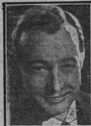
El gracioso actor germano Heinz Ruhman, protagonista de "No te vayas sin besar", de Hinf, que se estrena mañana