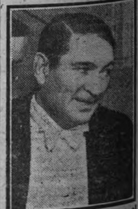
Victor Mc. Laglen, que en el film "Cuatro amigos" el Palacio mañana estrena el film de la Música, triunfa una vez más como actor de carácter