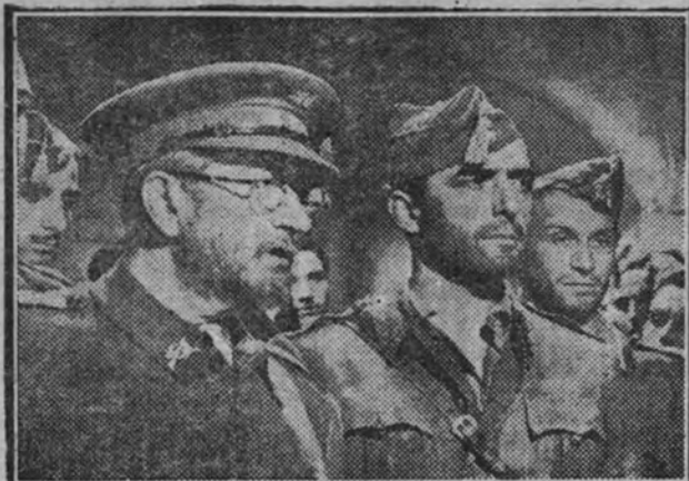
Acaba de ser premiada, en la Semana Internacional de Cine de Venecia, la producción Bassoli-Film-Uruguay "Sin novedad en el Alcázar". En la foto que reproducimos aparece el actor Rafael Calvo, una de las principales figuras del reparto