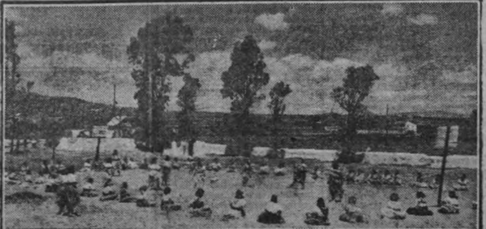
Ejercicios, bailes rítmicos, danzas... La salud, la gracia, el hondo y noble folklorismo de un pueblo antiguo y noble, que las camaradas de la O. J. de la Sección Femenina nos traen a la memoria, el gusto y la costumbre

Y, por último, para el 29 de octubre, Día de los Cedos, la Organización Juvenil prepara diversos actos, que mantengan vivo el recuerdo de aquellos camaradas que ofendieron el sacrosanctio de sus vidas en servicio de España.