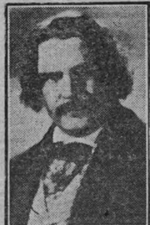
El gran actor Gabriel Gabrio en el papel de Honorato de Balzac, del film "Verdi", biografía cinematográfica del célebre compositor italiano que Hércules Film presentará esta temporada