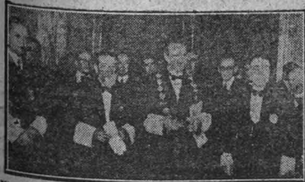
El ministro de Justicia con el presidente del Supremo y altos magistrados antes del solemne acto de apertura de los Tribunales. (Información en segunda página.)