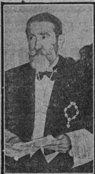
El presidente del Tribunal Supremo, D. Felipe Clemente de Diego.

El ministro de Justicia presidió el acto, pronunciando un gran discurso