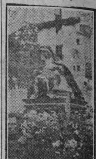
La imagen de Nuestra Señora de las Angustias a su paso por las calles del barrio de las Delicias durante la procesión del domingo.