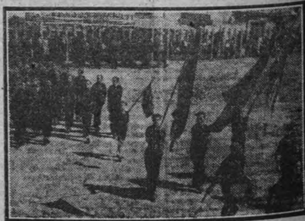
Los O. J. de Arganda desfilando ante las jerarquías, después de la inauguración de la Casa Sindical.

Inauguración de la Casa Sindical de Arganda