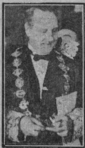
El ministro de Justicia durante su discurso.

Otra disposición del Gobierno nacional, la ley de Reversión de Penas por el Trabajo, es estudiada a continuación por el orador. Contra las concepciones que suponen los más terribles ultrajes a la dignidad humana se alza la ley de la redención de penas por el trabajo. No del trabajo for-