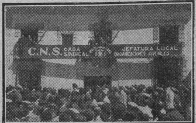
Fachada de la nueva Casa Sindical inaugurada en Arganda el domingo último.

ARGANDA 16.—Coincidiendo con las fiestas de la localidad se ha celebrado la inauguración de la Casa Sindical. Asistieron el delegado provincial sindical, el inspector provincial del Movimiento, el jefe provincial de Prensa y Propaganda, el inspector sindical provincial, autoridades locales y numerosos campesinos, que forman los Sindicatos. Los actos dieron comienzo con la celebración de una misa.