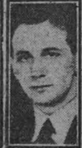
Antonescu Horia Sima

BUCAREST 17.—El jefe del Gobierno rumano, Antonescu, ha sido ascendido desde el grado de coronel al de general de Cuerpo de Ejército.