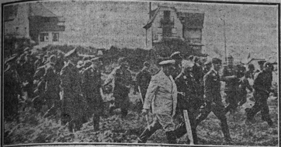
El mariscal del Reich, Goering, visita las localidades en que se desarrolló la batalla de Francia, acompañado por los oficiales de su Estado Mayor y los jefes del Ejército de ocupación.