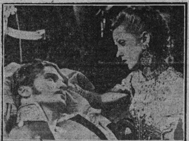
Danielle Darrieux y John Loder, en una escena de "Katia" (La princesa Bibesco), film anunciado para la inauguración de temporada del Palacio de la Música