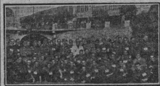
Camaradas del S. E. U. en su visita a la zona ocupada de Francia. Les acompañan oficiales y soldados de la guarnición de la frontera francesa.