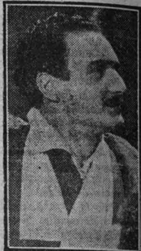
El magnífico actor y cantante Luis Sagi-Vela, en su creación cinematográfica "El último búsar", que interpreta en unión de Conchita Montenegro

exquisita Irene Dundee, en unión de un selecto reparto entre primerísimas "estrellas", responde por completo a todas las exigencias.