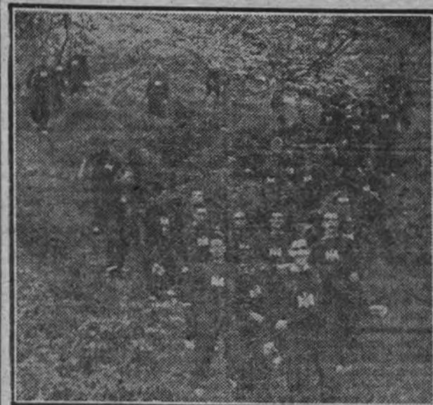
Los estudiantes del S. E. U. realizando una excursión.

Los muchachos, despazados a una ciudad divertida, hicieron vida de campamento, ajenos a la ciudad misma