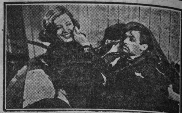
Un momento de la divertida producción R. K. O. Radio "El placer de vivir", en la que Irene Dunne logra una de sus mejores creaciones, y con la que el cine Avenida, ampliamente reformado, hace su reapertura el sábado