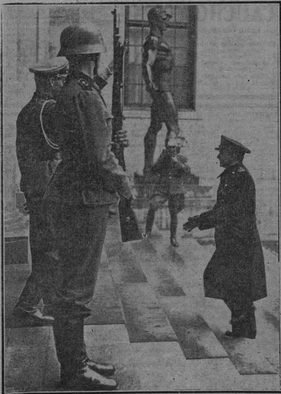
El presidente de la Junta Política, Sr. Serrano Súñer, subiendo la escalinata de la Cancillería para entrevistarse por segunda vez con Hitler.