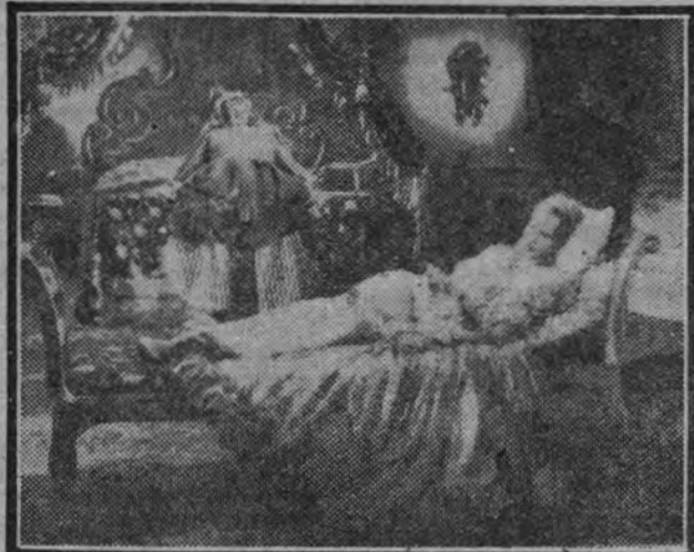
La Revolución francesa, marco emocionante de tantos films, culmina en interés y dramatismo con "El conde de Brechard", grandiosa producción que mañana presenta Cifesa en Rialto.