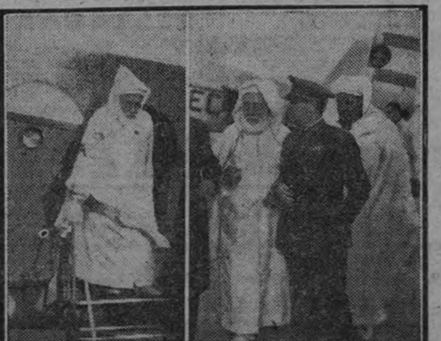
Los momentos de la llegada del Gran Visir al aeropuerto de Barajas.

Durante el día de hoy visitarán la capital, y mañana por la tarde, después de la llegada de los restantes miembros de la Comisión, cumplimentarán al ministro de Asuntos Exteriores, coronel Belgbeder, en su despacho oficial.