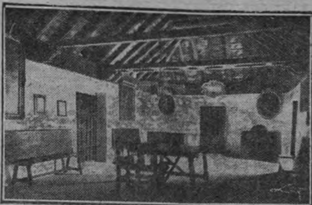
La Sala capitular, llamada del Padre Marchena, en el Monasterio de la Rábida, donde Vázquez Díaz realizó sus famosos frescos.

Buivamos el testimonio de nuestra condolencia a la familia de Francisco Durio, a sus amigos españoles y singularmente a Ignacio Zuloaga.