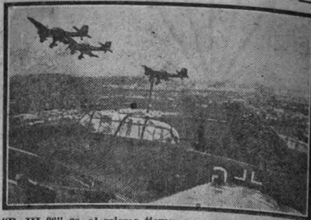
"D. III 88" es, al mismo tiempo que el más perfecto documental de la guerra aérea, la película de argumento más emocionante realizada hasta hoy. Su estreno en el Imperial promete ser un verdadero acontecimiento.

"D. III 88", verdadero poema cinematográfico de la aviación, película de aviadores, con un argumento humano y lleno de interés, es el primer estreno, al que seguirán las producciones de máxima categoría.