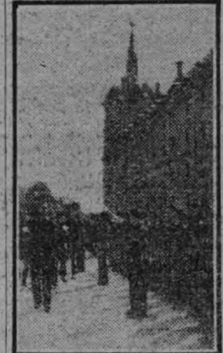
El delegado nacional de Sindicatos revistando a los 6.000 afiliados concentrados con motivo de la inauguración de la Casa Sindical.

la acción y tenacidad en la obediencia al mando, bajo la sombra vigilante de José Antonio y el constante recuerdo a los caídos, hacedores dignos del sacrificio y del servicio que prestaron, y juremos fidelidad a las banderas