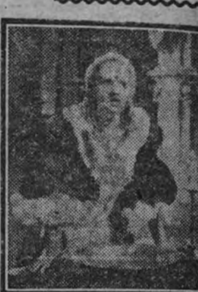
Luisa Férida, la encantadora "estrella" italiana, en una escena de la emocionante producción "El conde de Brechard".

Para todo lo relacionado con esta Sección, diríjase al redactor encargado de la misma.