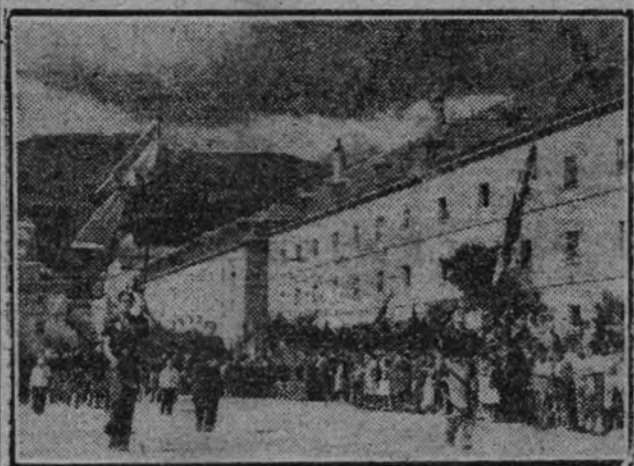
Los afiliados desfilando ante las jerarquías después del acto inaugural.

"En estos trágicos momentos del Continente, España y sólo España es la única entidad nacional que puede llevar a los demás pueblos la voz de la razón y de la fe." Terminó exhortando a todos los reunidos a que tuvieran fe en