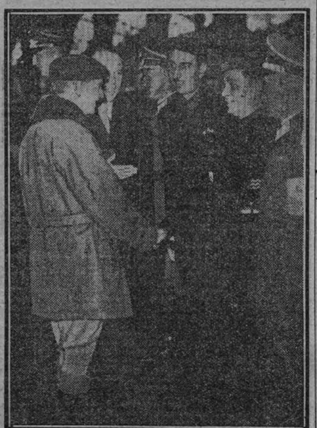
El presidente de la Junta Política, Sr. Serrano Suñer, a su paso por Bélgica fué cumplimentado en Bruselas por una delegación de la Falange, presidida por el cónsul general de España y por el jefe de la Falange de aquella capital.