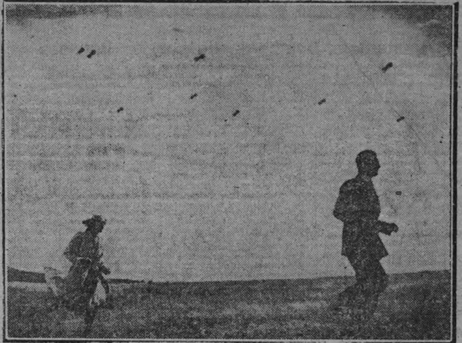
Una escena de "¡Atención, el enemigo escucha!".

Los estudios berlineses, no obstante la guerra, funcionan normalmente. En el primer año que ha cumplido ya Alemania de contienda —y de victorias— la vida de trabajo siguió su curso ascendente, superó su intenso y extenso ritmo de producción. Ninguna actividad interesante paralizó su latir, y menos el cine, siempre en marcha hacia su perfeccionamiento.