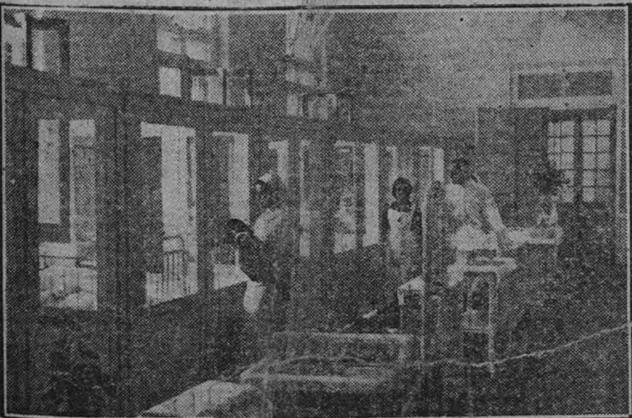
En "Nuestra misión", el documental realizado por la Sección Femenina están recogidos los aspectos más interesantes de la tarea con que nuestras camaradas salvan de la muerte a los niños de España.

Por último, se proyectará la película "Nuestra Misión", editada por la Regiduría Central de Prensa y Propaganda de la Delegación Nacional de la Sección Femenina.