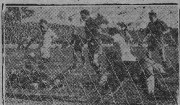
Valero se arroja a los pleg de Triana.