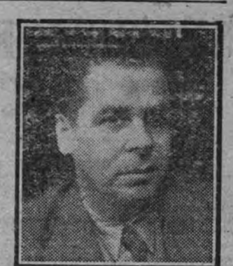
Ernst Kuhnly, jefe del Departamento Nacional del Teatro, Ministerio de Propaganda alemán.

La Falange no quiere cuentas con el diablo. Sabiales que se mueren demasados niños en España? Entre todos los llantos, el llanto por la muerte de los niños es el que está más lleno de melancolía, pero es también el que se vierte más de prisa y se acaba más pronto. Gran dolor inicial y luego olvido. Los pequeños no dejaban recuerdos. Mas