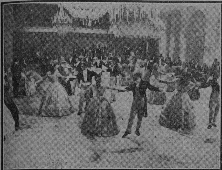
Un momento de la película titulada "Abandono".

De las dos funciones que se celebran cada día—una por la tarde, a las cuatro, y otra por la noche, a las nueve—, ésta última tiene empaque de sesión de gala. Aunque por la seriedad y sobriedad de la guerra no se edija el traje de etiqueta o el uniforme, para diferenciarse de la fastuosidad de los años anteriores—desplazada época de calma—, destaca en el público un tono elegante. Gráciles atavíos estivales de colores claros, en contraste con el cutis pigmentado por el sol, el alre y el agua de las mañanas pasadas en la playa de Lido, y un alarde, muy femenino, de alhajas en las espectadoras y limpios atuendos veraniegos en los hombres. La entrada al cine San Marcos, después de cruzar la plaza de este nombre, en completa oscuridad—sólo débiles luces de un azul sin bríos en los soportales—co-