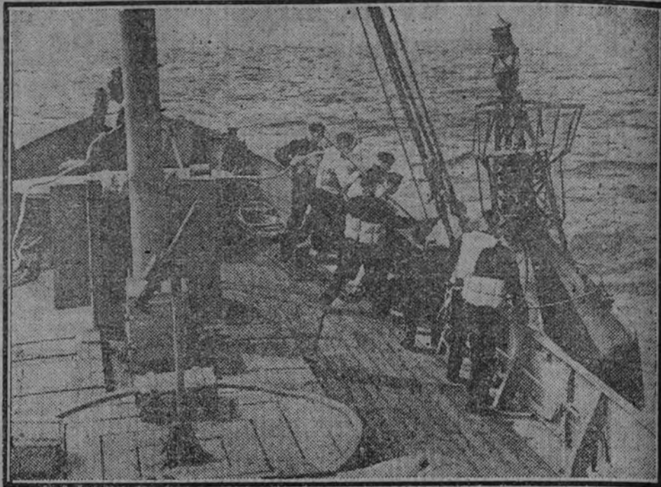
Lancha en un puesto avanzado de guardia.—Preparación de luces vigías.