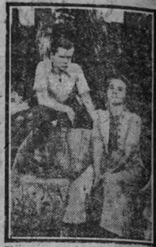
Una escena de "Reina a los catorce años", comedia creada por Diana Durbin que se estrenará próximamente.

— ¿Dónde está éste?, que me lo pargo... Y a poco mata al descuidado Antonio Vico.