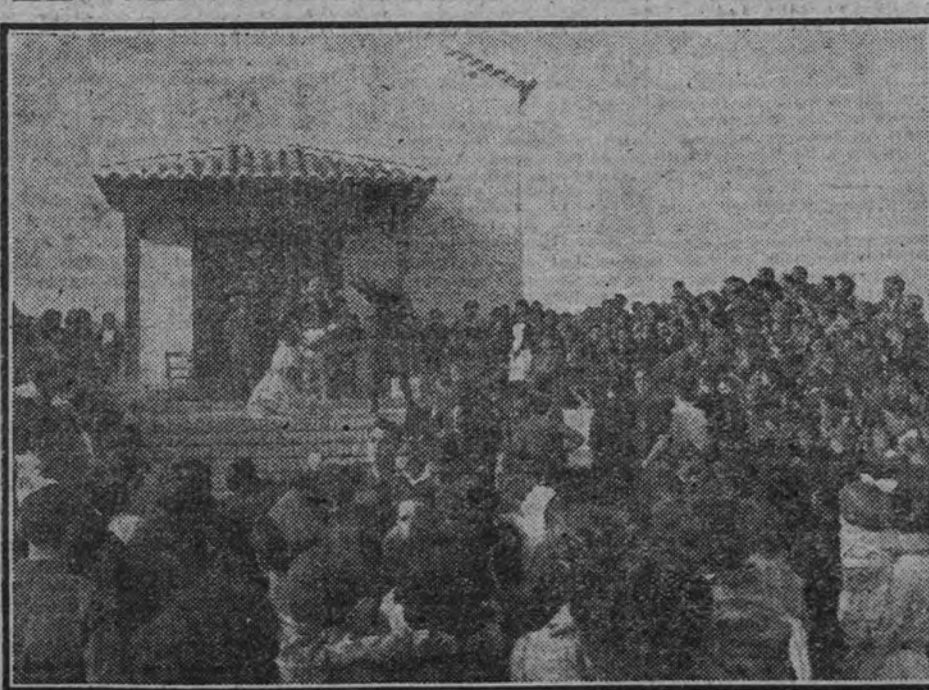
Una representación del Teatro de la Farandula, de la Falange Femenina, en el barrio obrero de Comillas, con asistencia de numeroso público.

Josefin, el héroe de la novela de Zunzunegui, el hijo de la ría, lo es también de la gran tradición de nuestra novela picaresca, nacida a orillas de otro río, el Tormes, y cuya fuente mana bajo la piel del asno del mercader de Corinto. Acaso se Apuleyo el padre de todas las novelas picarescas, aunque Lucio sea un infeliz, lo que no anda reñido con el golfante.