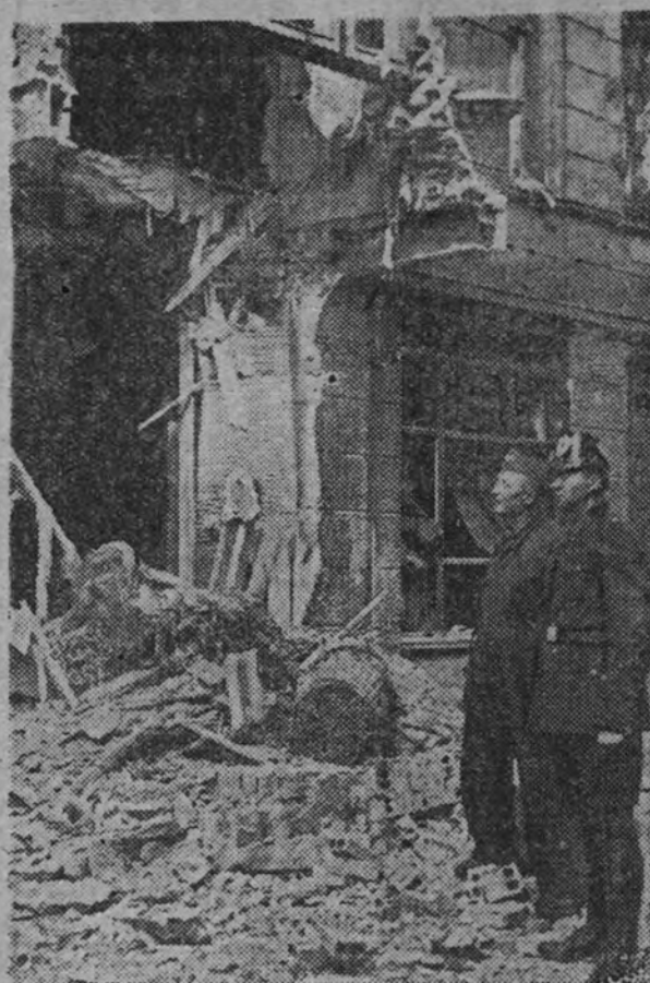
Efectos de uno de los últimos bombardeos ingleses sobre la capital del Reich.