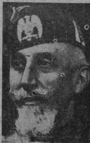
El mariscal Di Bono

El Caudillo ha dicho a las Falanges Femeninas: "Es necesario levantar a España, y vosotros vais a ser las adelantadas de la paz." Español: Ayúdanos a levantar España comprando el "Sello José Antonio".