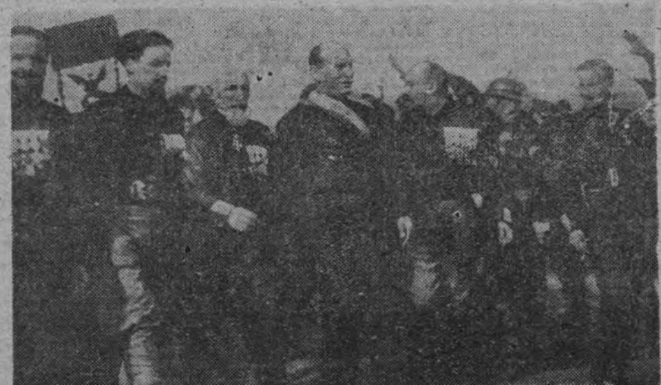
Los cuadriviros de la Revolución Fascista en la marcha sobre Roma

Pero estas cifras, estas estadísticas y estos gráficos no son fríos ni inanimados, no son hoscas y difíciles como otros pudieran serlo. Estos de hoy que la Falange exhibe son la única realidad y presencia de lo que todo lo mueve, el amor, y, como ya decía San Juan, "el que no ama ya está muerto"; y la Falange, viva y afanosa en su razón de vivir y de amor, nos da esta obra de verdad y de magnífica historia.