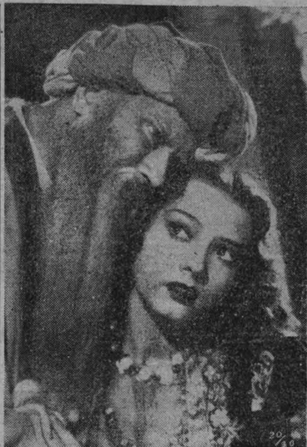
Emocional momento del film húngaro "Gül Baba".

Suecia... Este nombre tiene prestancia en la historia del cine. Para los públicos buceadores de biografías es la patria de Greta Garbo, la máxima artista filmica del mundo. Y de esa tierra lejana, en la punta opuesta de Europa, es también Zarah Leander, otra intensa e interesante creadora de sonoras vivas, de imágenes entre reales y de ensueño. Pero no es esto sólo de un valor meramente anecdótico. Desde los días de las pantallas mudas, Suecia y Noruega acertaron a expresar en sus películas de leve poesía, suaves y candorosas—excepto en las adaptaciones de las obras de sus atormentados y tormentados dramaturgos Ibsen, Björnson y Strindberg—, estas cardinales cualidades suyas. Y han seguido igual, en ese tono apacible, casi yerto, de Monarquía burguesa y socialista, que ahora, al tronar de la guerra, rectifican—tar-