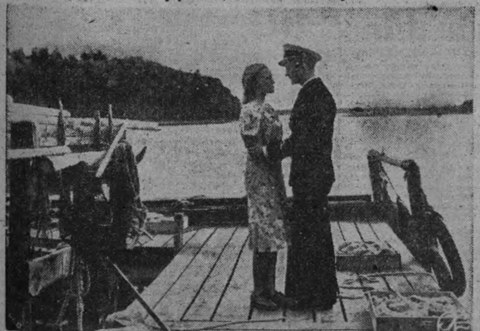
Escena de amor de "Cadetes", película sueca.

Y, por último, "El lobo del monte Surul", hecho en plena naturaleza, en un limpio y típico paisaje de Rumania—en la región, precisamente, que rotula la película—, es un sugestivo documental artístico, o sea que su trama verdadera de la lucha de los aldeanos contra las acometidas de esas fieras en el invierno aparece embellecida por una inspirada y cuidada labor directiva de Joup Rabner secundado por Angela Popescu de Martzy.