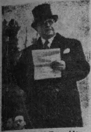
El mariscal Benavides