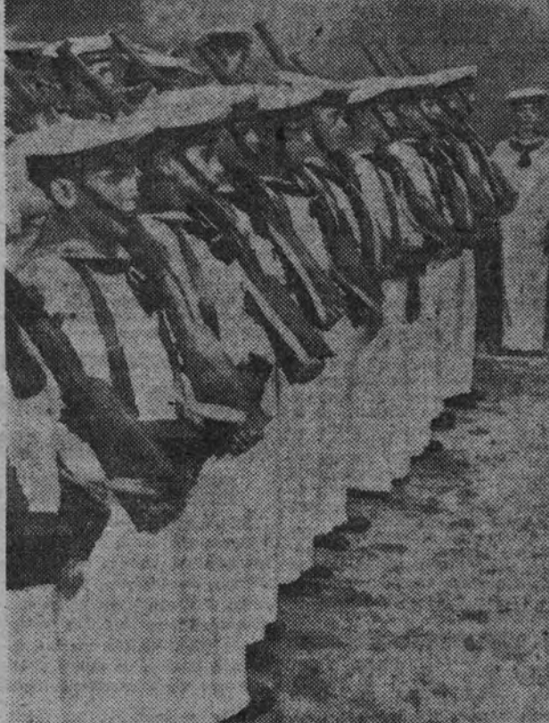
Los flechas navales que asistieron al acto inaugural de la Exposición.

Después se produjo un breve silencio, al que siguió un murmullo, entre sorprendido y aprobatorio, seguido de múltiples felicitaciones. Esto es todo lo que se sabe acerca de la reunión de los ríos de Europa.