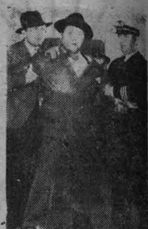
Un gracioso momento a cargo de Jack Oakie en "El mundo a sus pies", que mañana estrena el cine Callao