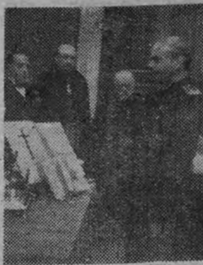
El ministro de la Gobernación, Sr. Serrano Súñer, en el momento de prestar juramento en la Academia de Ciencias Morales y Políticas

Si eres falangista pon en tus cartas el sello José Antonio.