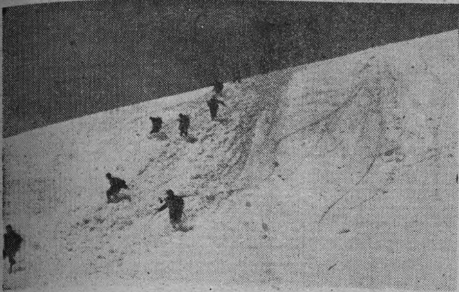
Escena del documental italiano "La batalla de los cuatro días"