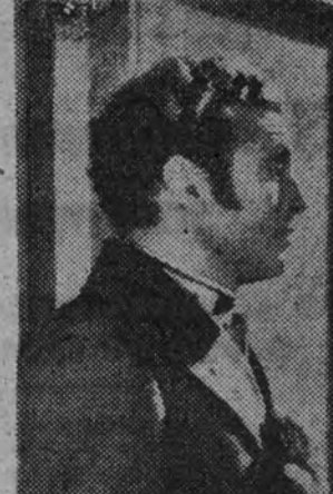
Allan Jones, que junto a Jeanette MacDonald, se destaca en el reparto de "La Esplá de Castilla", actualmente en el programa de Capitol

¿Quién es "El canillita"? Un "frescales" de Buenos Aires, figura popular del ambiente callejero, que vende periódicos para ganarse la vida. Su suerte y su ingenio le llevan a conquistar la fortuna, y se ve en un pa-