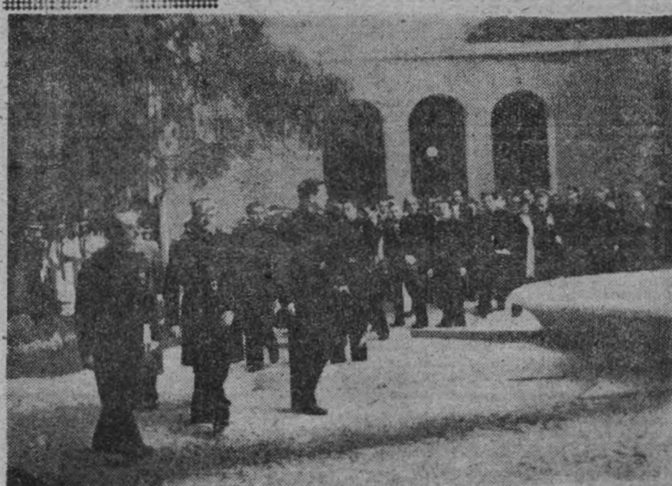
El presidente de la Junta Política, Sr. Serrano Súñer, inaugura la Exposición de la Expansión Española en el Mundo. (Amplia información en la pág. 3.ª)

bre el agua móvil de las olas con la quilla de los barcos de España. La gran historia universal de Europa no ha sido jamás hecha con las cotizaciones de la libra esterlina ni con las melodías peligrosas de los libros franceses. Lo que de Europa sale a conquistar mundos de modo permanente y trascendente arranca de Galicia, de León, de Extremadura y Andalucía, tiene abuelos romanos, lleva la Cruz delante; se llama España y Portugal; es decir, se llama Hispanidad. Todo lo se ha vertido en las tierras tejadas, desde los litorales ibéricos, a través de nuestros barcos. Eran aquellos tiempos navegantes, llenos de la aventura, el misterio y la grulla que siempre tiene el mar. Porque creemos firmemente en la vuelta poética del herblismo y la pasión hispánicas, creemos en los barcos y estamos en espíritu sobre sus ondulantes y españolas cubiertas que mil años de gloria han doctorado. Queremos y pedimos para ellos —grandes en la Galicia del obispo Gelmírez, en la Italia con barras de Aragón, en la moruna África del Emperador Carlos, en Lepanto; grandes en aquel 12 de octubre y grandes en la amarga grandad de 1893, y grandes en la hermosa tramada del "Balears"— el fondo amor de España que merecen. Y por eso estuvimos ayer con cuerpo y alma unidos al juramento que a nuestra bandera hicieron los alumnos de la Escuela Naval de San Fernando,