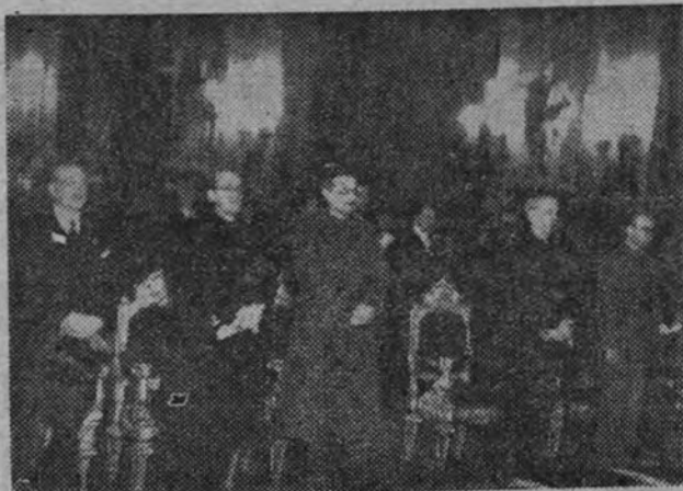
Ministros y personalidades en la presidencia del funeral celebrado en San Francisco el Grande en sufragio de los héroes hispanoamericanos caídos durante la Cruzada española.

MURCIA 12.—En homenaje a los caballeros mutilados se ha celebrado en el Parque una misa de campaña y la bendición y entrega de guirlandes, banderines y medallas al benemérito Cuerpo. Después de la misa se celebró un desfile de fuerzas del Ejército y de F. E. T. y de las J. O. N. S. Asistieron las autoridades civiles y militares y personalidades de toda la provincia. (Cifra.)