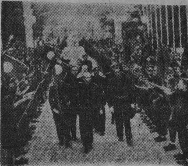
El presidente de la Junta Política, Sr. Serrano Súñer, pasa revista a las Organizaciones Juveniles en el recinto de la Exposición

Una reproducción de la "Santa María" destaca en el centro, y en varias vitrinas se exponen ediciones raras de las Leyes de Indias, códices e incunables, la gramática de Nebrija y otros valiosos ejemplares relacionados con el descubrimiento de América y la obra civilizadora realizada por España. Junto a un retrato de Isabel la Católica aparecen numerosos facsímiles de las traducciones de "El arte de navegar", de Pedro de Medina, y en diversos lugares del recinto se han trazado gran número de inscripciones, entre ellas una con el punto tercero de Falange Española Tradicionalista y de las J. O. N. S.: "España aleja su condición de eje espiritual del mundo hispánico, como título de