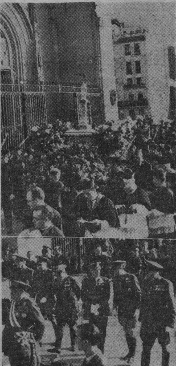
La procesión de la Virgen del Pilar que ayer recorrió las calles de Madrid, al salir de la iglesia de los Jerónimos. La presidencia del acto.

Hoy, domingo, durante la mañana, saldrá en avión para Sevilla la Misión Italiana que preside por el mariscal De Bono, ha sido huésped de honor de Madrid estos días.