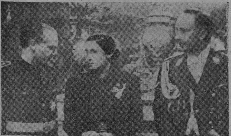
El Sr. Himmler conversando con Pilar Primo de Rivera y con el presidente de la Junta Política durante la fiesta ofrecida por éste en su honor

Ya en las primeras horas del domingo numeroso público se situaba en el itinerario que había de seguir la comitiva a la entrada del destacado jerarca alemán. En varios puntos, desde la calle de Oñesimo Redondo hasta el obelisco del Dos de Mayo, ondeaban