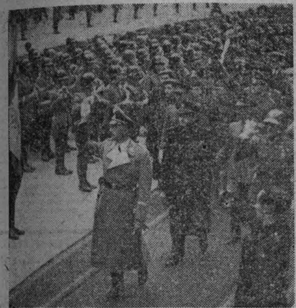
A su llegada a Madrid, el reichsführer Himmler revisita, en compañía del ministro de Relaciones Exteriores, a las fuerzas que le rindieron honores en la estación del Norte.

En el vestíbulo y galerías del gran edificio, decorado con tapices y adornado con plantas, formaron los camaradas de la Falange, y a la llegada de Himmler se encontraban con el presidente de la Junta Política las altas jerarquías que habían de concurrir a la comida.