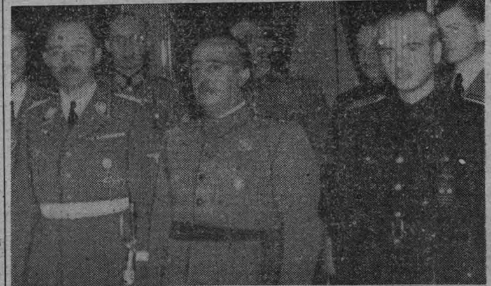
El Generalísimo, con el reichsführer Himmler y el ministro de Relaciones Exteriores, durante la visita del ilustre huésped alemán al jefe del Estado