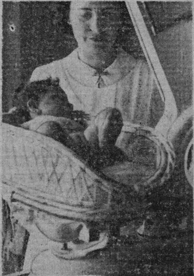
El peso de los niños, observado en los Centros de Alimentación Infantil, vigila su salud y desarrollo para reglamentar la nutrición.

médico desde su nacimiento hasta que cumplan los tres años reglamentarios, en que pueden ser acogidos en un hogar infantil o un comedor. A este fin han sido creados los Centros de Alimentación Infantil, difundidos por toda España, y que forman una vasta red que cuenta con cerca de 50 instituciones de esta índole, en las que se asiste y vigila por término medio, en cada una de ellas, de 1.000 a 1.500 niños, llegando a so-