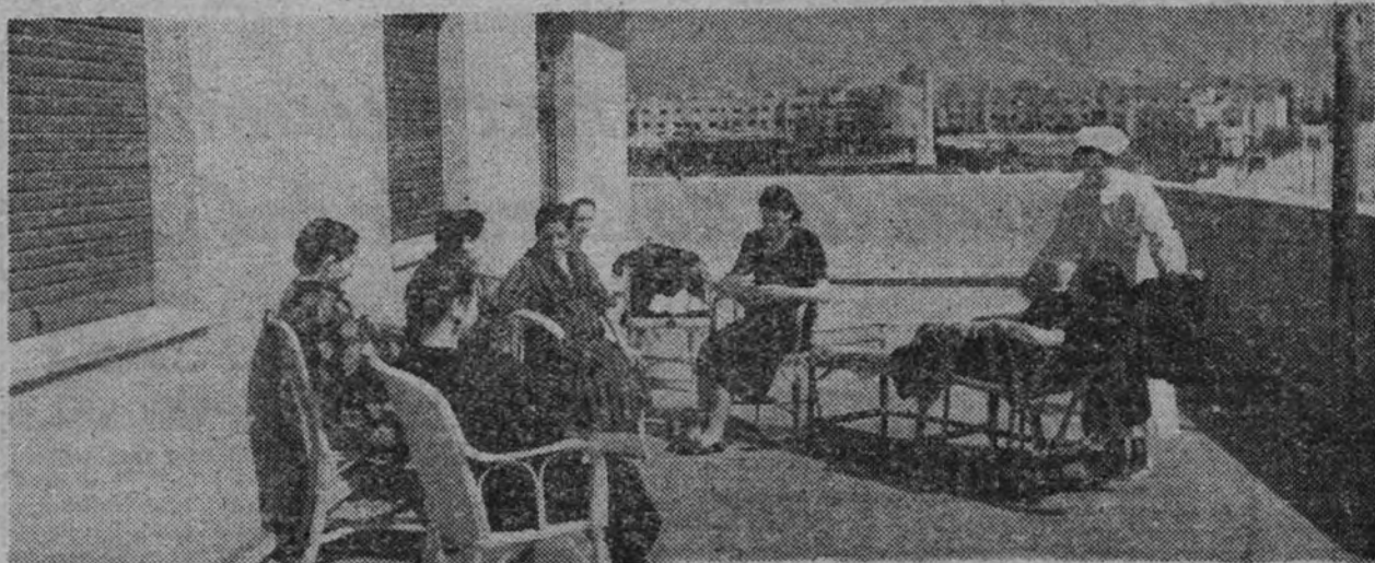
En la Maternidad de Auxilio Social, las madres reciben los cuidados más escrupulosos que su estado requiere.

Un dato magnífico, que sugiere un acertado optimismo, es el que vamos a resaltar. Las estadísticas del mes de julio de 1939 demuestran que de los 8.671 niños asistidos tomaban el pecho de su madre 2.131, lo cual representa un 56 por 100 de niños menores de un año. En cambio, el pasado mes de julio, de 40.181 niños asistidos existen 15.380