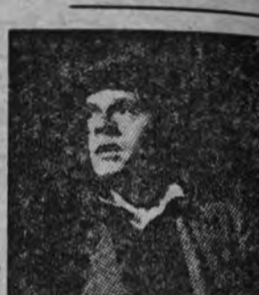
Mickey Rooney en "Forja de hombres", primer premio de interpretación de la Academia de Ciencias y Artes Cinematográficas de Hollywood.

Todo, en la nueva producción, hace augurar un resonante éxito: la romántica trama, desarrollada en un país imaginario, fácil al ensueño y al idilio; la espléndida presentación, difícilmente superable; los valiosos elementos técnicos em-