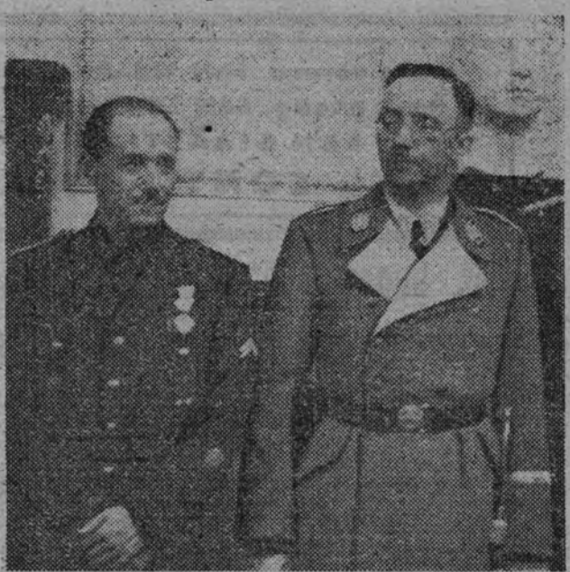
El reichsführer Himmler en su entrevista con el conde de Mayalde, director general de Seguridad.