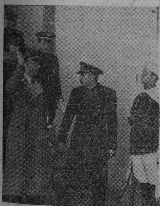
El jefe de la Policía alemana, Sr. Himmler, al salir del palacio de El Pardo, de visitar al Jefe del Estado. Le acompaña el presidente de la Junta Política, camarada Serrano Súñer.