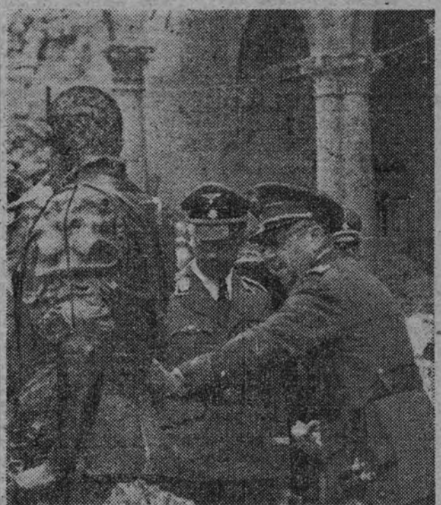
Durante su visita al Alcázar, el Sr. Himmler escucha de labios del general Moscardó detalles de la heroica defensa.

tos Exteriores Himmler, acompañado por el ministro y presidente de la Junta Política y seguido siempre por las personalidades de su acompañamiento, se trasladó a la residencia de Su Excelencia el Jefe del Estado en El Pardo.