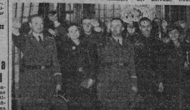
El jefe de la Policía alemana con el ministro-vicepresidente del Partido, la secretaria general de Auxilio Social y otras personalidades, en el hogar de esta obra de hermandad en la calle de María de Molina.

(Viene de primera página.) Una información sobre la presencia y actividad en España del jefe de la Policía alemana y de las Milicias S. S., doctor Himmler. En los titulares se pone de relieve la cordial acogida dispensada por el pueblo español al colaborador íntimo del Führer.