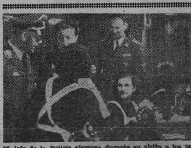
El jefe de la Policía alemana durante su visita a los talleres de Auxilio Social.