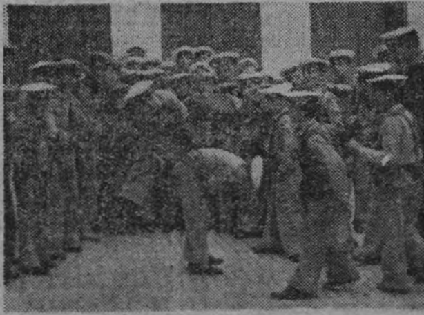
En los juegos de los camaradas de la O. J. hay siempre una actividad y un movimiento que habla de sus energías y de su perfecta formación física.