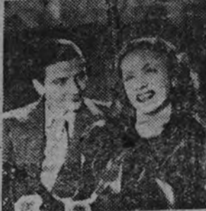
Una escena de "Abuso de confianza", la gran creación de Danielle Darrieux, que será presentada próximamente.

Todos los niños duran hoy a la hora de la siesta un regocijo sobre los caballitos blancos.