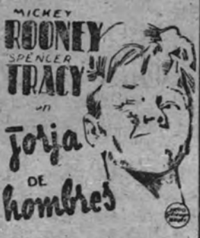
Spencer Tracy y Mickey Rooney en un momento del largometraje film "Forja de hombres", cuyo estreno anuncia para mañana el Capitol.