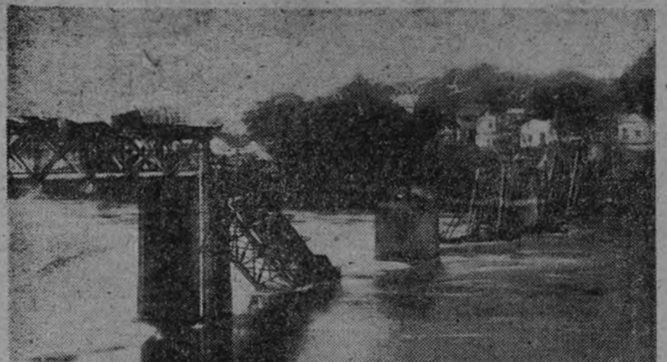
El camino de Birmania ha sido abierto al tránsito de material de guerra para el ejército de Chang Kai Chek, pero los aviones de Tokio se encargan de entorpecer este refuerzo a los rebeldes chinos con eficaces bombardeos sobre los puentes y otros puntos principales de la famosa ruta.