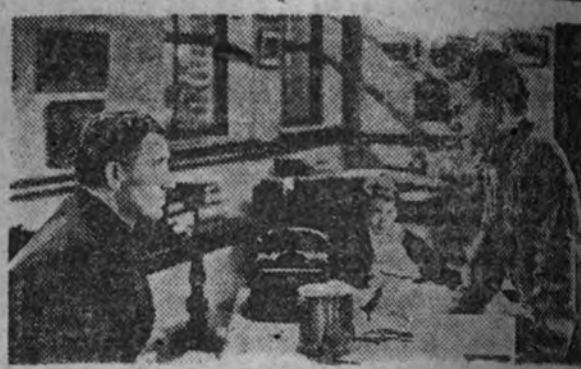
Spencer Tracy y Mickey Rooney en un momento del largometraje film "Forja de hombres", cuyo estreno anuncia para mañana el Capitol.