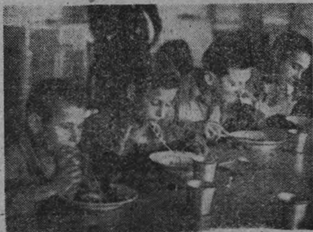
La hora del rancho, salpicando la comida con los chistes y las risas, que ponen un gesto alegre en la cara de cada uno