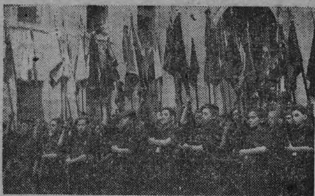
Banderines y guiones de las O.O. J.J. de toda España en El Escorial durante el acto de ayer.