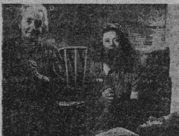
Una escena emocionante del film "Sin novedad en el Alcázar", obra maestra de la cinematografía. "Sin novedad en el Alcázar" ha obtenido anoche, en el Avenida, con su solemne presentación, un éxito tan extraordinario como merecido.