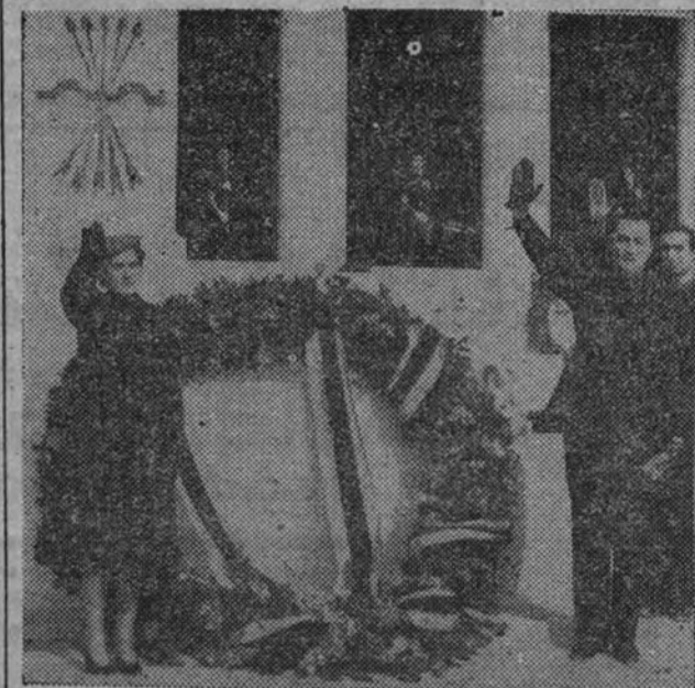
En la Ciudad Universitaria fué ofrendada una corona ante la Cruz de los Caídos. Los jefes provinciales, con la corona, en el momento de la ofrenda.

EL NUEVO SECRETARIO DEL PARTIDO ROMA 29.—El nuevo secretario del Partido Fascista, Adelchi Serena, tiene cuarenta y cinco años, y es uno de los fundadores del Fascismo en Italia. Después de haber luchado como voluntario en la Gran Guerra desempeñó importantes cargos políticos en el nuevo régimen. En los últimos años fue vicesecretario del Partido, y en octubre de 1939 fue nombrado ministro de Obras Públicas. Es doctor en Derecho.