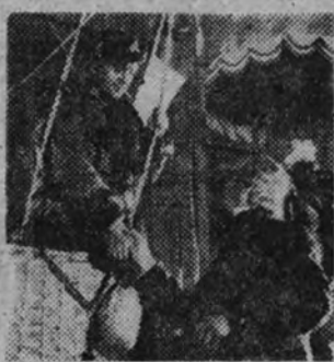
Una escena de la interesantísima producción "Besos fatales", cuyo estreno anuncia para mañana el cine Figaro