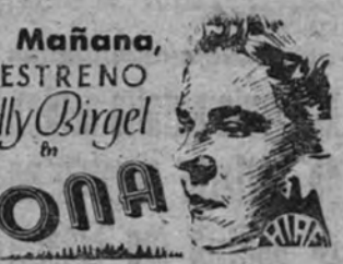
na de dos caracteres gigantes, a que lo conduce una trama de novelescos y apasionantes incidentes, cuyo