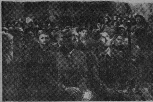
Una de las escenas de más profunda emoción de "Sin novedad en el Alcázar": el momento de la misa, que los héroes sitiados escuchan en éxtasis, mientras la muerte cerca el toledano edificio, gloria de nuestra Cruzada