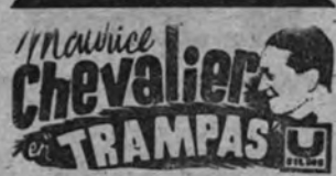
Originalísima comedia policíaca que apasiona, intriga y divierte. MASANA, LUNES, PRIMER REESTRENO EN