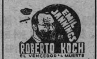
Los colosos frente a frente

MASANA, LUNES, la emocionante superproducción, genial creación del gran trágico