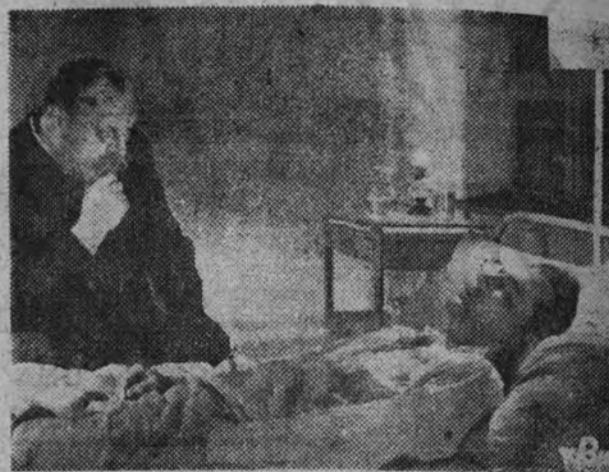
"Roberto Koch", grandiosa creación de Emil Jannings, que se estrena mañana en el Imperial