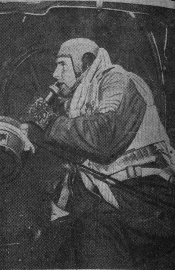
Vuelan incesantemente sobre Londres los aviones alemanes y sus servidores radiotelegrafistas envían a Berlín noticia inmediata de los resultados de los ataques y de la marcha de las operaciones