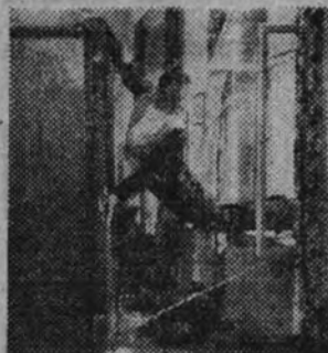
Rühmann, el gracioso actor, en una escena de "El héroe de la pista", producción con la que inaugura mañana su temporada de estrenos el cine Muñoz Seca

Los asistentes felicitaron a los señores Bassoli y Ullrich por el éxito obtenido con la magnífica producción.