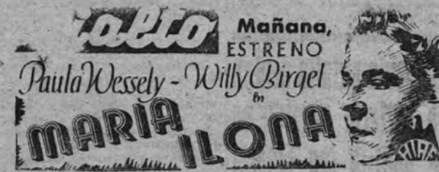
Mañana, ESTRENO. Paula Wessely - Willy Birgel en "MARIA ILONA"

ROMEO Y JULIETA. Segunda semana de éxito. NORMA SHEARER. LESLIE HOWARD.