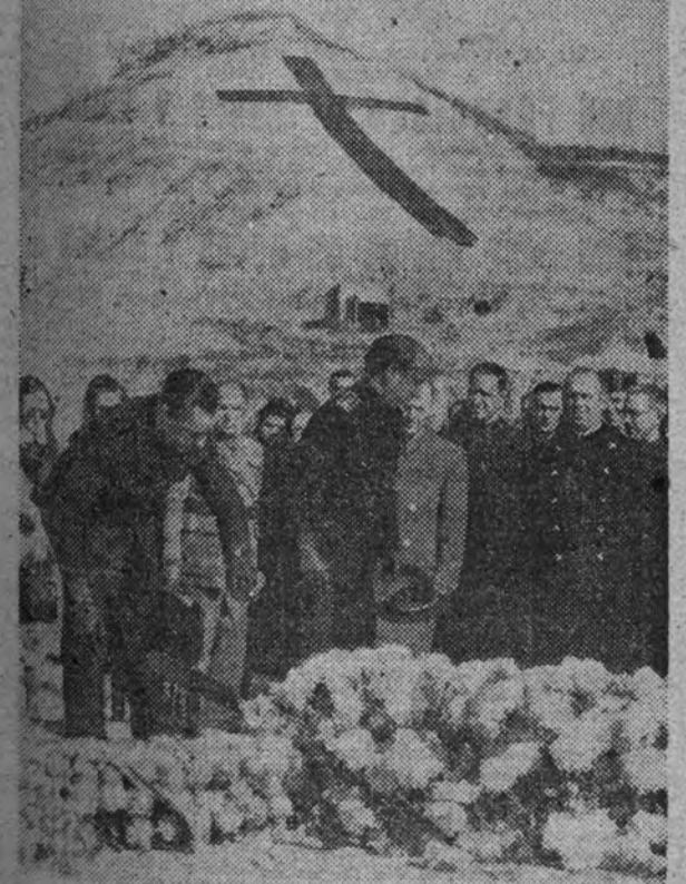
En nombre de la Falange, los camaradas Miguel Primo de Rivera y Manuel Valdés cubren de flores el lugar donde cayeron asesinados hace cuatro años tres mil españoles cuando las banderas de Franco batían el viento que recogió su último "Arriba España".

Aguas del Ebro y del Cidacos, presas y riegos del Lodosa, han sido unificadas en Calahorra por la Central Nacional Sindicalista. Los campesinos usufructuarios han entrado en el común sindical de la Falange para arrimar el hombro cortado al esfuerzo de todos. Como sus aguas, que, simbólicamente, han sido unidas al agua toda de España, al agua única que ha de regar el único campo que posea el hombre único de mañana. Es el viento de nuestra bandera, que alisa para siempre la superficie de la Patria; es, también, el amor y la firmeza de un Partido que tiene sus raíces en lo alto y en lo bajo porque conduce la Revolución que uno y no disgrega, la Revolución de todos, que quiere libres los ríos y los hombres, que quiere libre la comunidad general de la nación, con sólo el yugo del esfuerzo y con sólo la grandeza de Dios.