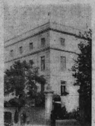
El nuevo local de la Escuela de Ingenieros de Montes, inaugurado ayer.

Se cantó el "Cara al sol" y se aclamó con gran entusiasmo a España y a Franco.