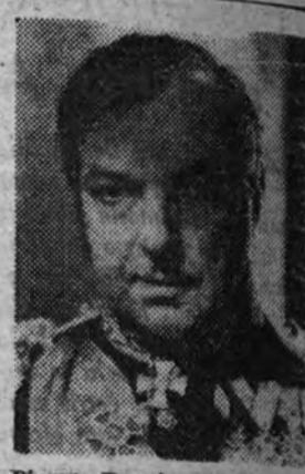
Pierre Renoir en la gran película "El zar loco", superproducción que el Imperial estrena el lunes