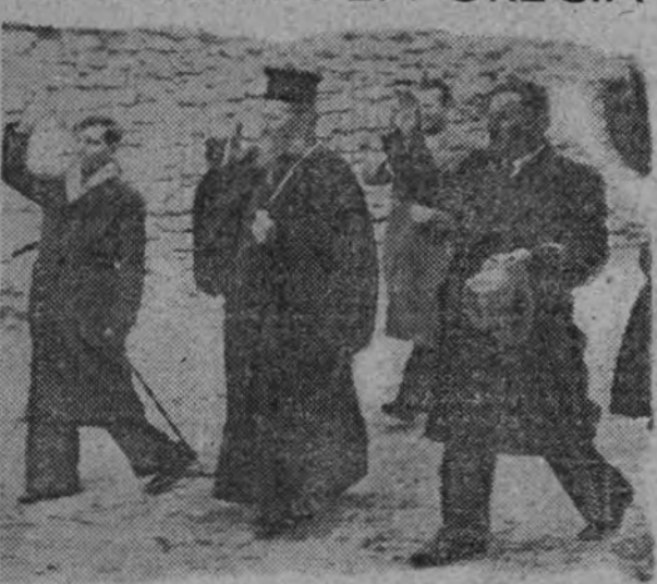
Las autoridades de uno de los pueblos ocupados por las fuerzas italianas en la Clameria, salen a recibir a los vencedores.