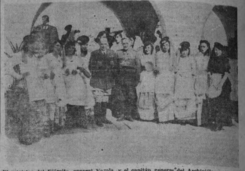
El ministro del Ejército, general Varela, y el capitán general del Archipiélago, con un grupo de señoras, que tomaron parte en la fiesta típica que fué ofrecida al ministro durante su estancia en la ciudad de Las Palmas.