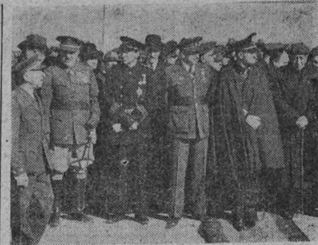
El subsecretario del Aire con las autoridades de Zaragoza y el embajador de Italia, en la ceremonia de inauguración del cementerio de aviadores italianos caídos en la guerra de España.

Hitler mirará los viejos rostros, las expresiones grises, recordará los claros abiertos por la Muerte y dirá: "Y ahora, camaradas, ya podemos comenzar a trabajar".