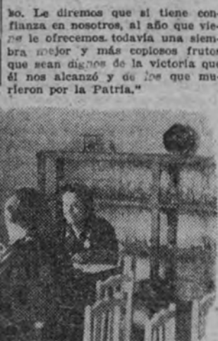
Un detalle del comedor en la Escuela de Mandos de la Ciudad Lineal.