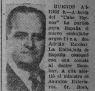
ro acento, dijo las siguientes significativas palabras:

El doctor Escobar se propone desarrollar una labor intelectual y económica