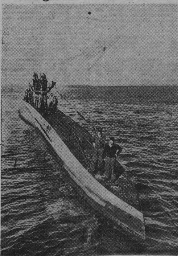
Un submarino alemán regresa a su base después de una campaña contra el tráfico británico.