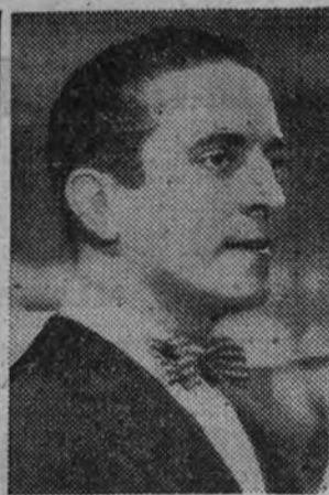
Roberto Rey, protagonista de "Marido provisional", producción española próxima a estrenarse.

COMICO.—(Loreto-Chicote.) 6,30 y 10,30: La tía de Belmonte.