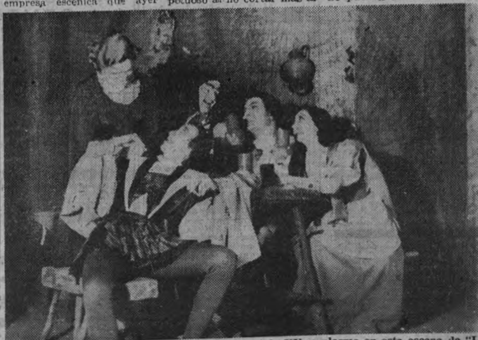
La picaresca española de las postrimerías del siglo XV se plasma en esta escena de "La Celestina"

La obra fué seguida con gran interés por el público, y cálidos aplausos premia-