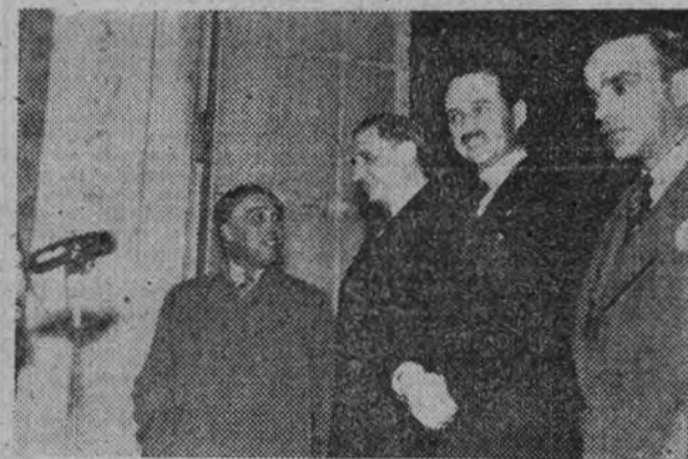
El presidente del Consejo, doctor Oliveira Salazar, teniendo a su derecha al ministro de Obras Públicas y a su izquierda al subsecretario de Estado de las Corporaciones, asiste al desfile de las Corporaciones portuguesas en el Día Sindical.