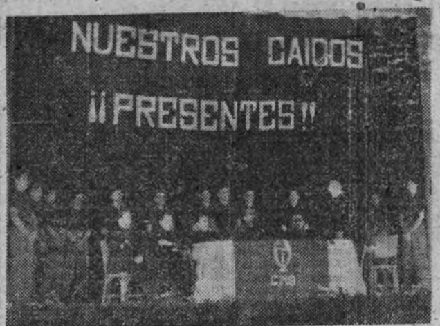
La presidencia del acto de clausura del curso de enlaces sindicales.