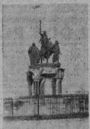
El monumento a Isabel la Católica, que será trasladado al Hipódromo de la plaza de San Bernardo.

Isabel la Católica, al extremo de la Castellana. Ahora se trasladará, acompañada por las figuras del