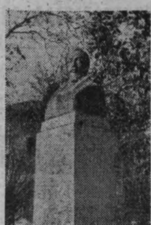
El monumento a Larra, que en la actualidad se encuentra en el paseo del Prado, será trasladado a los jardines de la calle de Ballén.

los heroicos Daoiz y Velarde, los cuales tampoco han pagado hasta el momento de hallarse en la plaza del Des de Mayo. Pues ¿y los reyes de piedra, fabricados en serie bajo la dirección de Castro y Olivieri? ¿Y los "chisperos" ("los salneteros"), que amenazaban con su alre bronco y retador todo el turismo de la estación del Norte?