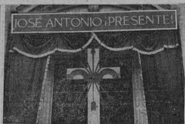
La iglesia de San Ignacio, de Roma, decorada con motivo de los funerales celebrados en el IV aniversario de la muerte de José Antonio.

Decreto autorizando al ministro para la ejecución por el sistema de contrata de las obras de "Ampliación de los muelles de Tablada y de su zona de servicio en el puerto de Sevilla"; las obras de "Terminación del espigón para transatlánticos" en el puerto de Gijón; las de "Muelle de Abrigo" en el puerto de Camelle (Coruña); las de "Adequinado de parte de los muelles del puerto" en el de San Felix de Guisela; y las de "Enlace con la carretera" en el puerto de Mugia (La Coruña).