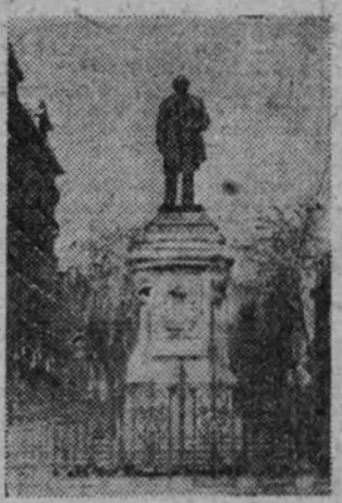
La estatua del marqués de Salamanca, que pasará de la calle de Velázquez a la plaza de su nombre.

Gran Capitán y del Cardenal Mendoza, a la plaza de San Bernardo. Se llamará el bulevar paseo de Isabel la Católica. Y el marqués de Salamanca irá desde la calle de Velázquez a la plaza de su nombre. Y Larra... Al "pobrecito habrador" se ha decidido sacarle del Prado. Irá a recrearse a los jardincillos de Ballén, donde el viento de la Sierra mueve la fronda del Campo del Moro. ¿No hubo, a fin de siglo, dispersión de dioses en el Prado olímpico y popular? Entonces, ¿los manes de Ventura Rodríguez hubieran podido conmovérsele?