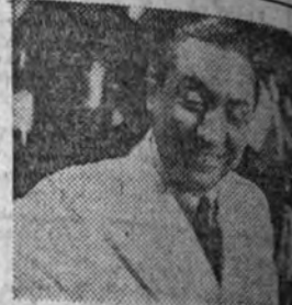
Pedro Chicote, el célebre "barman", se nos revela como actor cinematográfico en la película "El famoso Carballo", próxima a estrenarse.

Comunica a su público que a partir del domingo y días sucesivos la sesión continuará dar comienzo a las once de la mañana para terminar a las doce de la noche