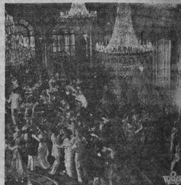
Una escena de la película "Roberto Koch", que se viene proyectando con gran éxito en el cine Progreso

Muy pronto, en esta semana, se estrenará "Julietta y Romeo" en una de las primeras pantallas de la avenida de José Antonio, siendo distribuida por la conocida marca Balet y Blay.